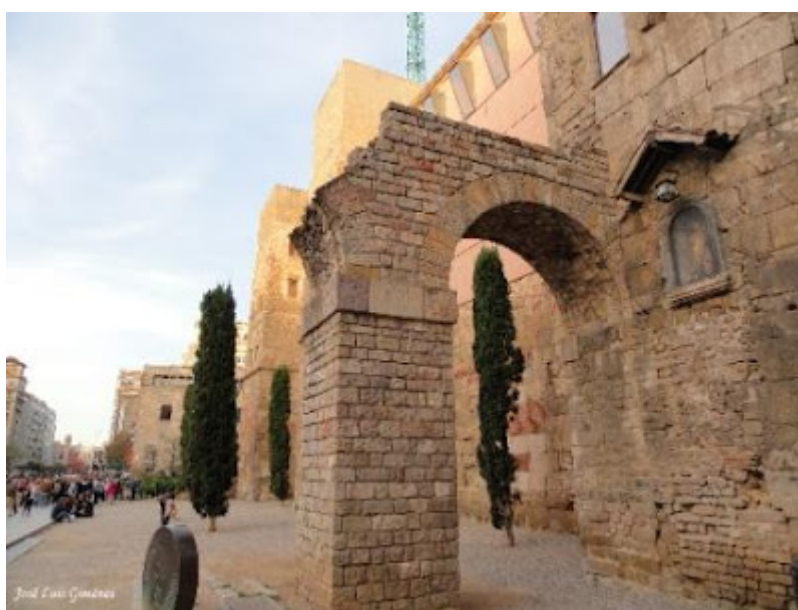
Murallas romanas junto a la Catedral

De la época de los romanos, aún hoy día, podemos encontrar restos de las imponentes murallas que rodearon a la ciudad y que en la actualidad han quedado integradas en los edificios como parte de los mismos.