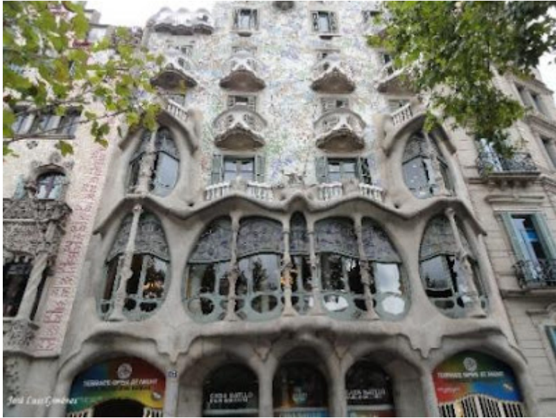
Casa Batlló Pº de Gracia, 43 (Arq. Antoni Gaudí)

En este reportaje vamos a descubrir una pequeña muestra de los muchos edificios modernistas existentes en Barcelona, verdaderas obras de arte arquitectónico, que se han convertido en indiscutibles símbolos de la ciudad.