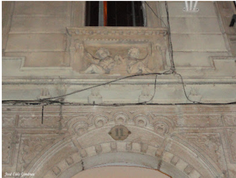
Detalle de símbolos masones: Escuadra, paleta y compás. Calle Portaferrisa, 11

Pero aquí no vamos a hablar de la Masonería o Francmasonería, sino de las huellas que ésta ha dejado en Barcelona, a través de algunas de sus construcciones más emblemáticas, en las que relevantes personajes, arquitectos, constructores y mecenas, han contribuido a que Barcelona sea una ciudad cultural, poliglota y polifacética en todas sus actividades.