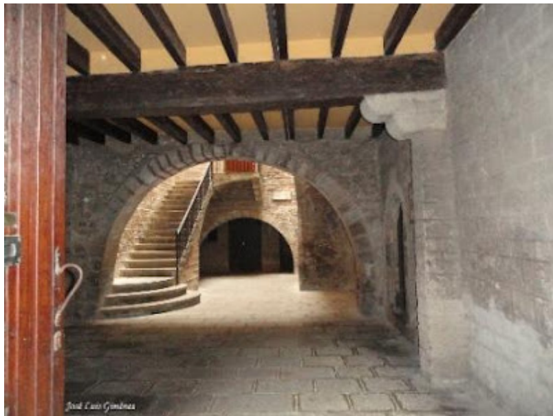
Templo romano, entrada

En la fundación mitológica de Barcelona, vemos como Heracles es favorecido por Hermes quien, no en vano, era considerado el dios del arte.