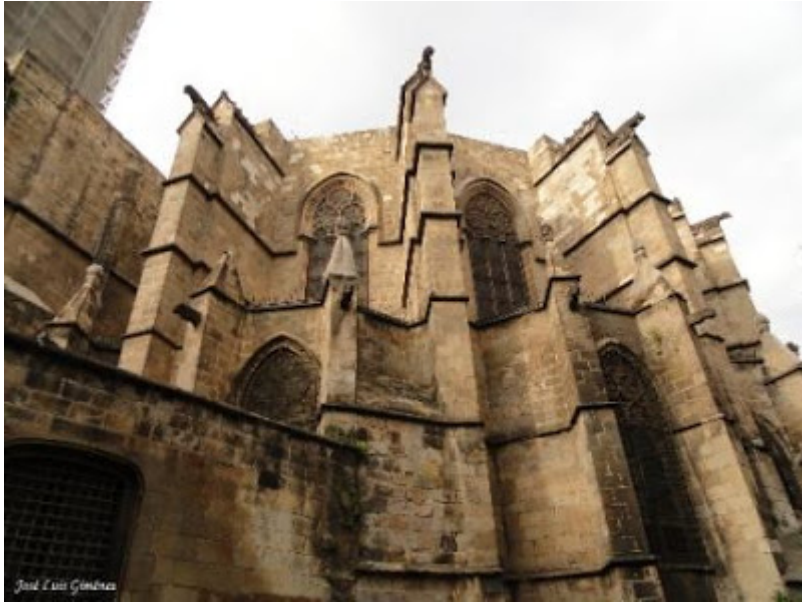
Catedral de Santa Eulalia y de la Santa Cruz de Barcelona – ábside – gárgolas y seres mitológicos – Barrio gótico

Francia), pasan a formar parte del territorio franco, promoviendo que en el año de 878, Guifré El Pilós, sea nombrado conde de Barcelona, de Girona y de Besalú.