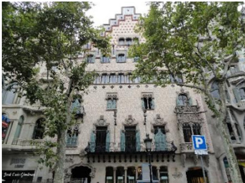
Casa Amatller. Pº de Gracia, 41 (Arq. Josep Puig i Cadafalch)

Ahora nos toca conocer la faceta que quizá haya dado más fama a la ciudad Condal, y ésta no es otra que los edificios modernistas.