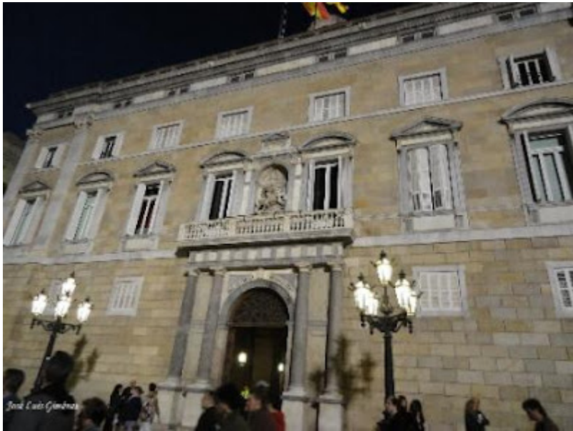
Plaça de Sant Jaume – Palau de la Generalitat

Pero si la historia mitológica de la fundación de Barcelona resulta atractiva, no lo es menos la Historia documentada.