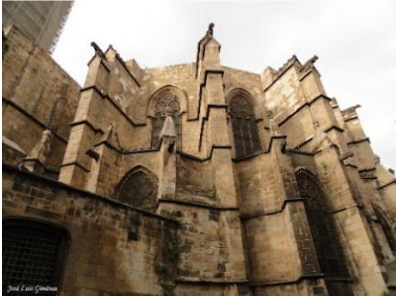
Catedral de Santa Eulalia y de la Santa Cruz de Barcelona – ábside – gárgolas y seres mitológicos – Barrio gótico

Francia), pasan a formar parte del territorio franco, promoviendo que en el año de 878, Guifré El Pilós, sea nombrado conde de Barcelona, de Girona y de Besalú.