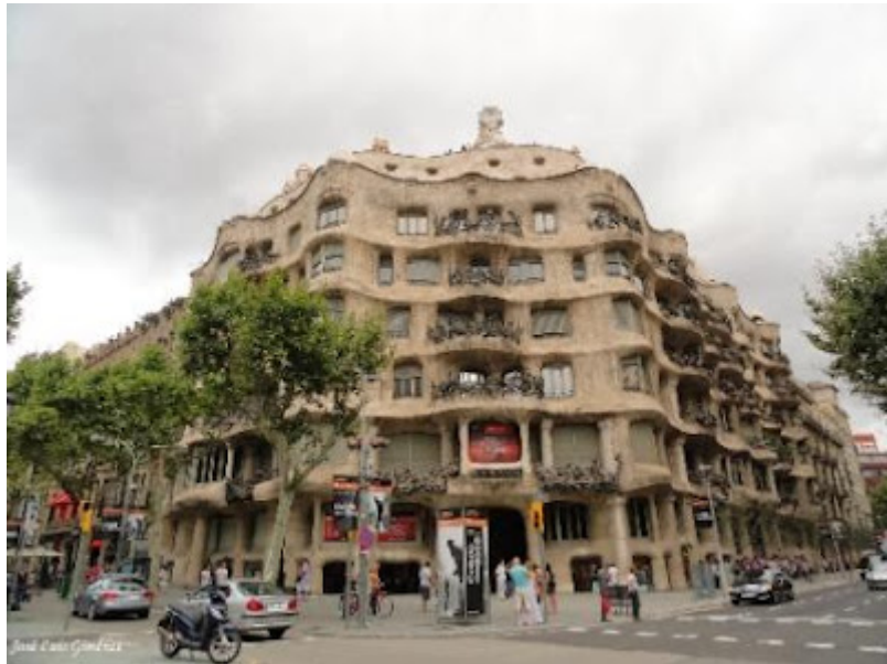
Casa Milá o “La Pedrera” – Antoni Gaudí.