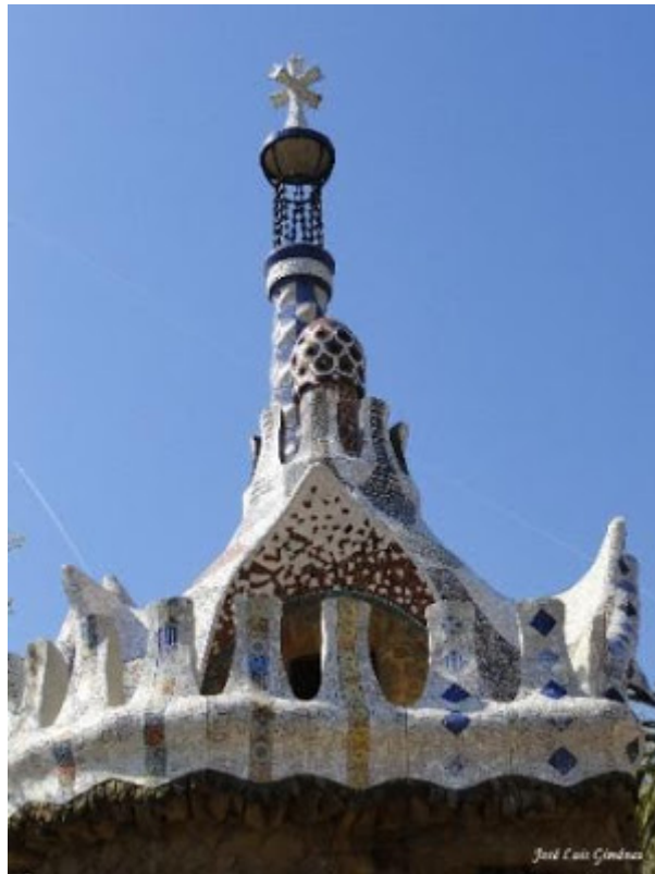
Park Güell – Casa del conserje