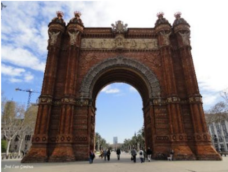
Arc del Triomf (Arco del Triunfo). Obra realizada en 1888 que sirvió de acceso a la exposición Universal de Barcelona de dicho año. Situada entre el Paseo de Lluís Companys y el Paseo de Sant Joan

La descripción que de la Masonería o Francmasonería hacen los propios masones, donde la palabra «masón» proviene del inglés (en francés maçon), y cuyo significado sería: albañil o constructor; y la palabra «franc», que proviene de franco o libre, conforman el nombre de Francmasón, y su significado haría referencia al «libre constructor».