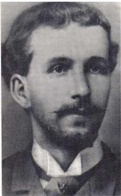
José Asunción Silva (1865-1896)