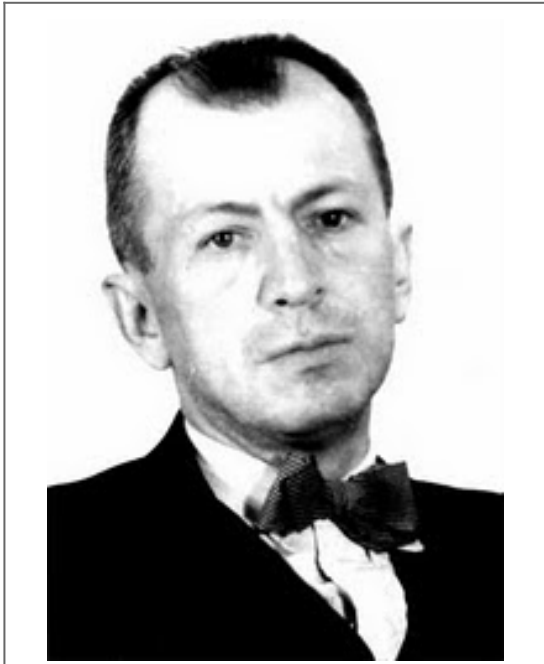
Aurelio Arturo (1909-1974)

“Pero el dulce muchacho de mi niñez hace mucho tiempo se ha marchado yo no sé para dónde”.