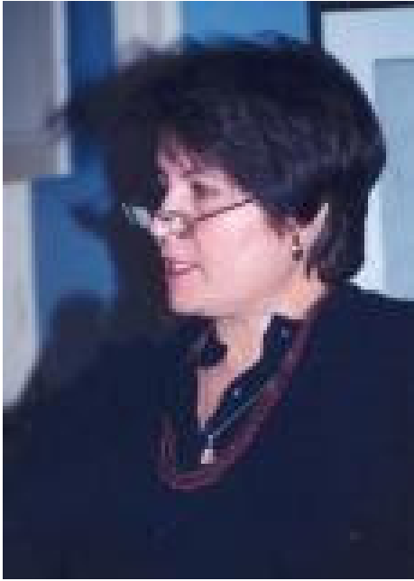
Maria Mercedes Carranza

“Los poetas que vienen después del auge del nadaismo y que comienzan a publicar sus primeros libros a fines de la década del 70, hablan de la generación sin nombre, la antipoesía, la poesía política, la poesía de la imagen y la poesía en prosa. La utilidad descriptiva de su clasificación alude más a influjos que al carácter específico de cada escritor. Mediante su lectura podríamos detectar el influjo de poetas tales como Cavafy, Borges, Octavio Paz, Lezama Lima, Ernesto Cardenal, Alejandra Pizarnik, los surrealistas, los beatnik, la más reciente poesía latinoamericana, la vertiente latinoamericana del surrealismo, y un desdén inexplicable por la tradición poética española. Flotamos, entonces, en la luz, perdidos en el asombro de la dicha, incrédulos de que la felicidad sea por fin esa palabra que podemos palpar como quien acaricia un cuerpo, tan resistente como vulnerable, tan fragmentario como único” (12).