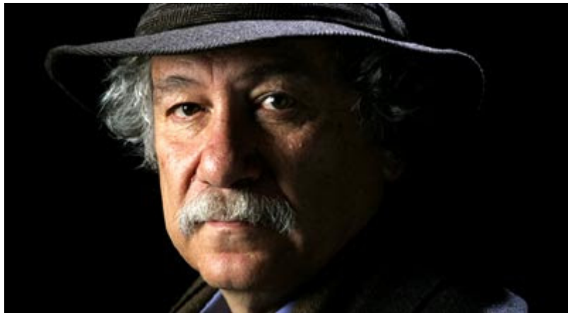
Juan Manuel Roca

“El arte de Juan Manuel está definido por la imagen, como responsable de la permanente transmutación de la realidad. Su poesía es un fabuloso ejercicio de la imaginación, no sólo como creador, sino también por la capacidad de su verso para someter al lector a las reglas fantásticas de su universo poético, que sin embargo nos remite siempre a lo bello o lamentable de nuestra condición de ciudadanos de la violenta realidad del sueño. El resultado de leer a Roca es el de quedarnos atrapados en la riqueza de posibilidades significativas de sus poemas, en la actualización de sus muchos sentidos. Es tan fuerte su mundo mágico, poderosamente imaginativo y onírico, tan visual y sensitivo, que uno podría olvidarse de que el poema está hecho de palabras cuando entra a ser habitante de un país surreal. Que sigue siendo el nuestro” (9)