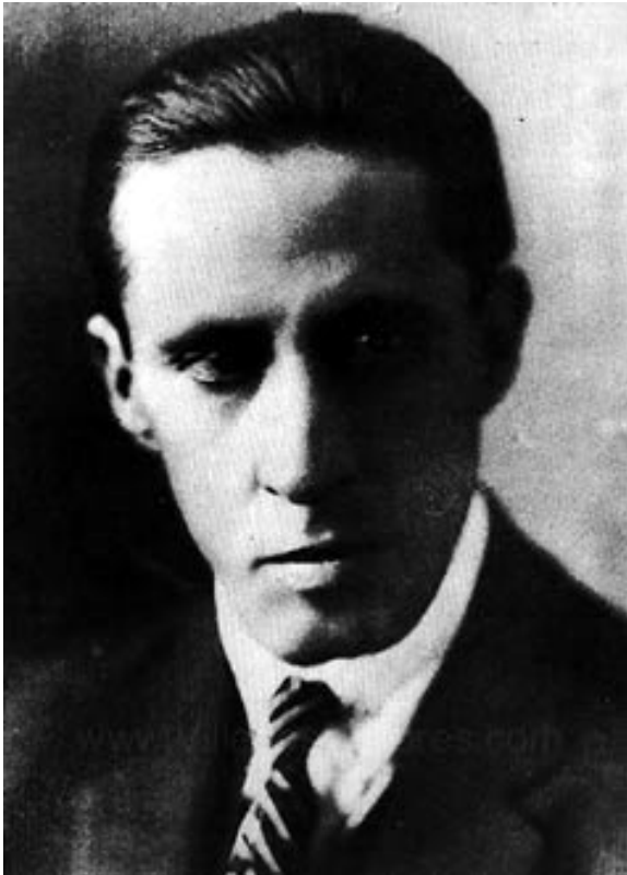
Porfirio Barba-Jacob ( 1883-1942)

Mi interés por la poesía, especialmente por la poesía colombiana, es muy remoto. La primera vez que tuve en mis manos un libro de poemas, las palabras despedían un casto olor alcanforado que me crispó los pelos. Entre los poemas que nos dejó Julio Flórez (1867-1923), hay un reguero de brumas, lágrimas, cadáveres y bambucos que en noches de luna y calles solitarias algún guitarrero se atrevía a cantar a su amada con suma melancolía. En alguna de esas calles, José Asunción Silva (1865-1896)