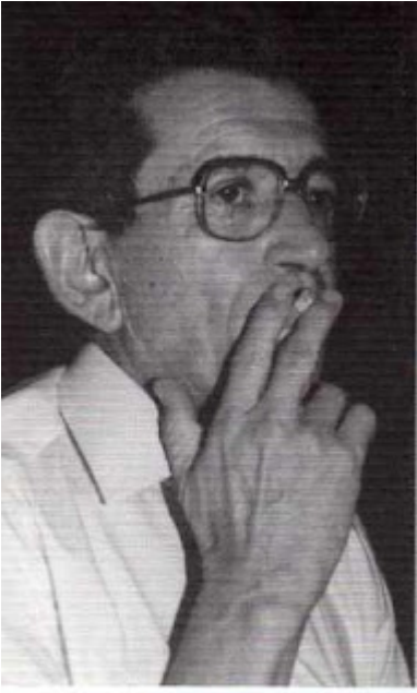
José Manuel Arango

Gonzalo Arango tuvo la osadía de rebelarse contra los moldes imperantes en la sociedad y contra la estética de su tiempo. Con él salieron a las calles poetas de brujean y barba casposa, sin pelos en la lengua y comenzaron a despotricar contra los gramáticos de la Academia y contra los intelectuales católicos. “Esto, unido al lenguaje procaz, las brillantes paradojas y el rechazo a cualquier actividad burguesa productiva despertaron la curiosidad primero e inmediatamente después la difusión de sus ideas no sólo en el ámbito nacional sino también internacional” (5). Las fronteras fueron abiertas para darle paso al existencialismo criollo y al surrealismo, tanto que ebriedad ya no rimaba con castidad sino con Sartre y el marqués de Sade –esteta del sufrimiento -, fue tan cotidiano como cualquier peatón del aire. Era el tiempo del Jazz, de Brigitte Bardot, de iniciación a nuevos goces; la marihuana y la música tendieron los primeros puentes hacia el territorio del asombro, Pero ese territorio ya no era rural ni bucólico sino