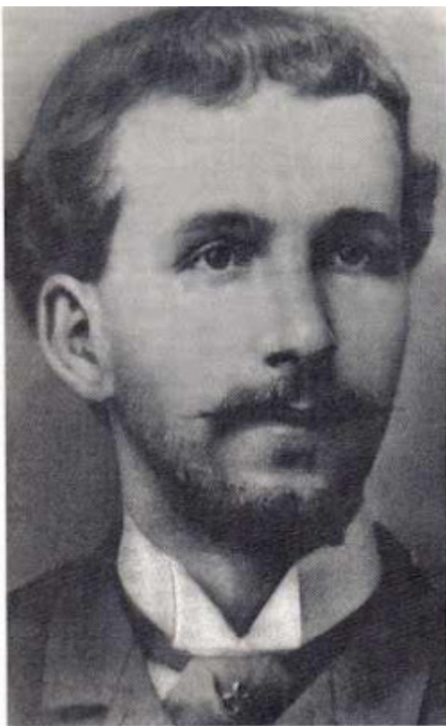
José Asunción Silva (1865-1896)