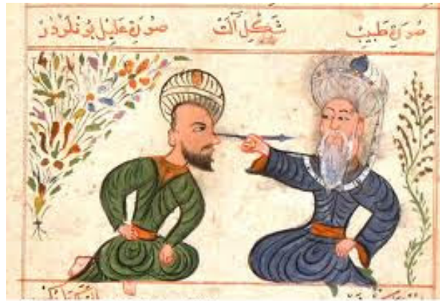
Operación de cataratas. (s.XV)

Sus médicos conocían a Galeno e Hipócrates. Diagnosticaban muchos males, practicaban intervenciones muy avanzadas, desinfectaban sus instrumentos y drogaban al paciente para evitarle dolores. Conocían la sutura y la circulación menor de la sangre. Tenían hospitales (institución copiada de los hindúes), con dependencias para enfermos, enseñanza, farmacia, administración y huertos para el cultivo de plantas curativas. La medicina andalusí tuvo gran fama entre los cristianos, que enviaban a los suyos a tratarse, como el rey de León, Sancho el Craso. Destaca el cordobés Abulcasis, autor de una enciclopedia médica muy completa