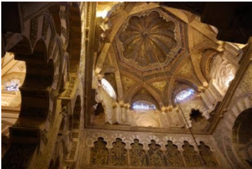
Cúpula Mezquita de Córdoba

Con una formación excepcional, fue nombrado sucesor a los ocho años. Ya califa (961), transformó Al-Ándalus en foco cultural y protegió su florecimiento. Defendió siempre el dialogo antes que la guerra. Fundó 27 escuelas públicas en las que renombrados maestros, pagados por el estado, enseñaban a los necesitados. Creó una biblioteca con más de 400.000 ejemplares. Asimismo, amplió la gran