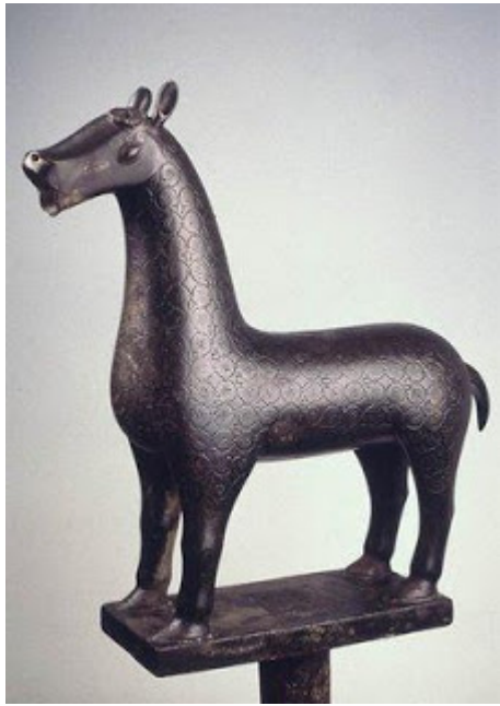
Joya encontrada en Medina Azahara

Florecieron en las grandes ciudades, que crecieron en actividad y población, contrastando con la crisis urbana europeo-medieval. Por su parte, los oficios artesanales se organizaban en gremios, corporaciones públicas dirigidas por un "amín" y sometidas a un "zabazoque" o "señor del mercado" , una de las tres máximas autoridades de la ciudad, junto al gobernador y el juez. La industria más importante fue la textil (lana, lino, seda y algodón); otras: cuero, cestería, cerámica, yesería, ebanistería, orfebrería, cristalería y armas. En el califato se introdujo el papel, traído por mercaderes árabes de China y transmitido al mundo cristiano. Játiva (Valencia), fue el primer centro productor.