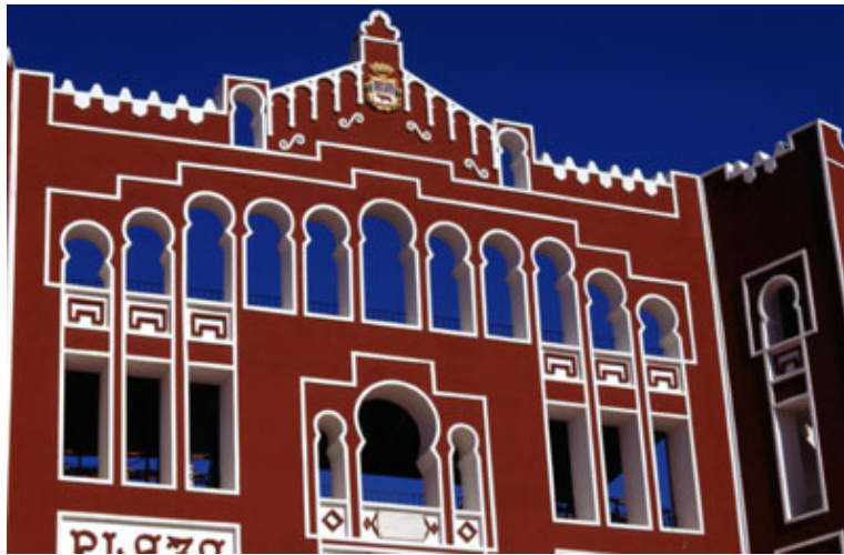
FACHADA PRINCIPAL DE LA PLAZA DE TOROS