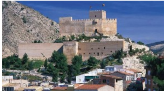
CASTILLO DE PETRER

Este Castillo (siglo XII-XIII) está situado sobre un promontorio llamado Cerro del Testigo de unos 461 metros de altura. Domina su vista sobre las poblaciones de Petrer y Elda, enmarcadas dentro del valle del Vinalopó y pertenecientes a la provincia de Alicante. Castillo fronterizo por el tratado de Almizra (1244), pasa a territorio de Castilla.