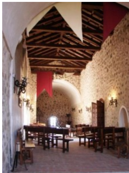
Interior del Castillo de Consuegra

Un buen destino es este lugar para disfrutar de un turismo selecto. No solo en sus fiestas medievales, emblema regional, sino en ese Cerro Calderico con sus doce molinos de viento, recorriendo su Plaza de España o asistiendo a esas Fiestas de la Rosa del Azafrán.