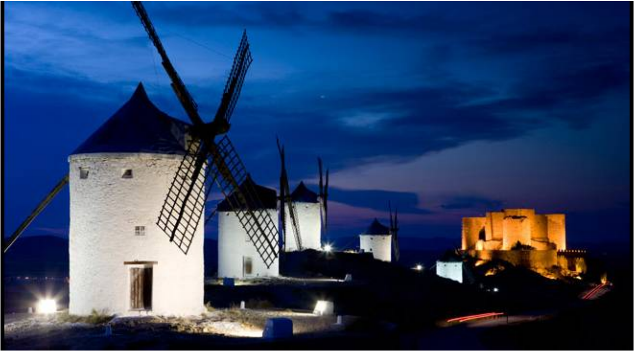
Molinos de Consuegra

Tal vez, allí donde acampan buenos labriegos de fina estampa, sobrevive aquel lugar que hiciese huella el romano cuando habitó Consabrum, poniendo un anfiteatro para abrir fastos de honor, tiene más pasado rico que pobre y digo rico en naturaleza e historia. Romanos sabios que dieron paso a los árabes conquistadores.