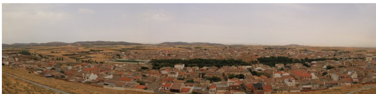
Panorámica de Consuegra desde el cerro del Tío Calderico

Entre las mieses doradas que abren senderos luminosos por doquier, el Campo de San Juan enaltece el paisaje toledano, un paisaje donde la historia cuajó tremendos acontecimientos que hicieron grande su espacio.