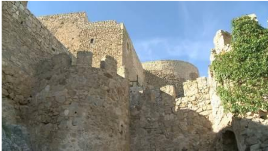
Castillo de Consuegra

Y es, en aquellos finales del siglo XI, cuando la historia nos habla de hechos de leyenda que hacen más grande Consuegra. Conquistada Toledo en 1085 por Alfonso VI y verificada la entrada de los almorávides en España a la llamada de Al-Mutamid de Sevilla, todo alcanzó situaciones de extrema dificultad, más no en vano en el año 1090 Castilla tomaría posesión de esta gran fortaleza castellana, muy notable a la sazón, pero que muy pronto, unos años después, sufriría el acoso de los temibles almorávides donde Alfonso de Castilla intentaría resistir, perdiendo la batalla y refugiándose entre sus muros firmes.