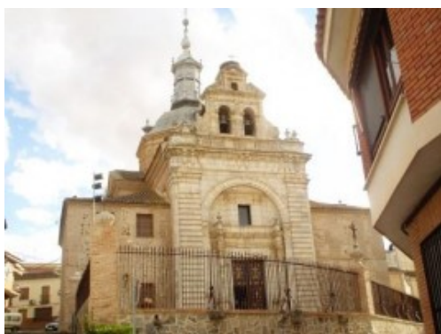
Iglesia del Santísimo Cristo de la Vera Cruz

Entre las mieses doradas que abren senderos luminosos por doquier, el Campo de San Juan enaltece el paisaje toledano, un paisaje donde la historia cuajó tremendos acontecimientos que hicieron grande su espacio.