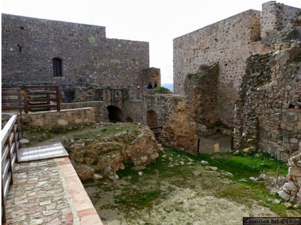
Interior del Castillo de Consuegra

llevar, repoblando con buenas gentes que ahora heredaron esa raza y carácter y haciendo cabeza de un Priorato poderoso.