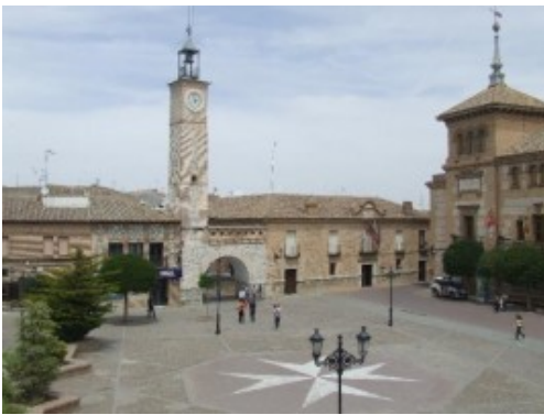
Plaza Mayor de Consuegra

Mancha Baja o tierra de anchuras indefinidas, donde le horizonte confunde en la misma línea sol y tierra, habitada y deshabitada, llena de brillos especiales donde caminan labriegos, pastores y hombres nobles que hicieron tierra de terratenientes en otros tiempos y se gestaron grandes hazañas de poderosos y de humildes. Tierra donde el Quijote Quijano a bien tuviera hacer andanza y donde Sancho cubriera de buena cocina sus angosturas estomacales.