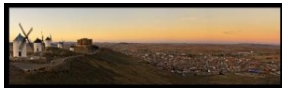
Vista de Consuegra desde el Cerro Calderico

No dejen de visitarlo y admiren toda su estampa, es digna de ello. Yo así lo veo.