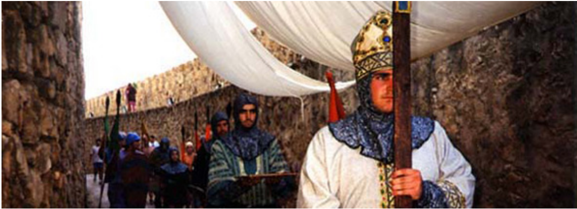
Fiestas medievales de Consuegra

Un buen destino es este lugar para disfrutar de un turismo selecto. No solo en sus fiestas medievales, emblema regional, sino en ese Cerro Calderico con sus doce molinos de viento, recorriendo su Plaza de España o asistiendo a esas Fiestas de la Rosa del Azafrán.