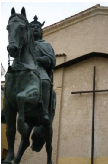
Monumento a Alfonso VIII, conquistador de