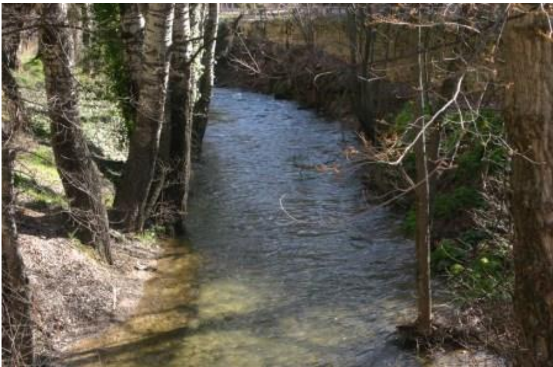
El río Huecar

entre pinares los colores se desvanecen ondulan figuras disueltas al agua de humo cada barco iza las velas entre espuma y vapor puerta de San Juan ha parado el tiempo hacia el exilio interior