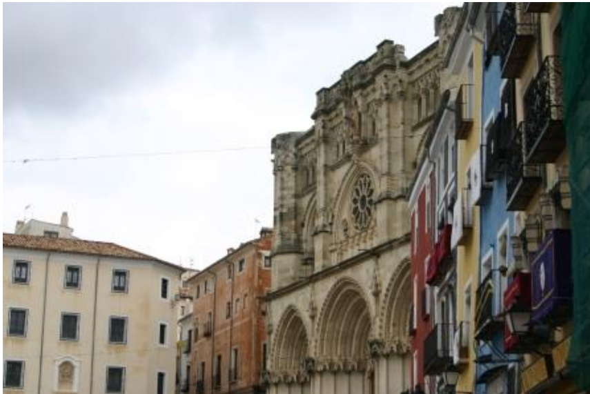
Cuenca y su catedral

Cuenca «la grande», que nunca tuvo un caballero porque los tuvo a cientos. Una ciudad que es un pasodoble, la mires, por donde la mires.