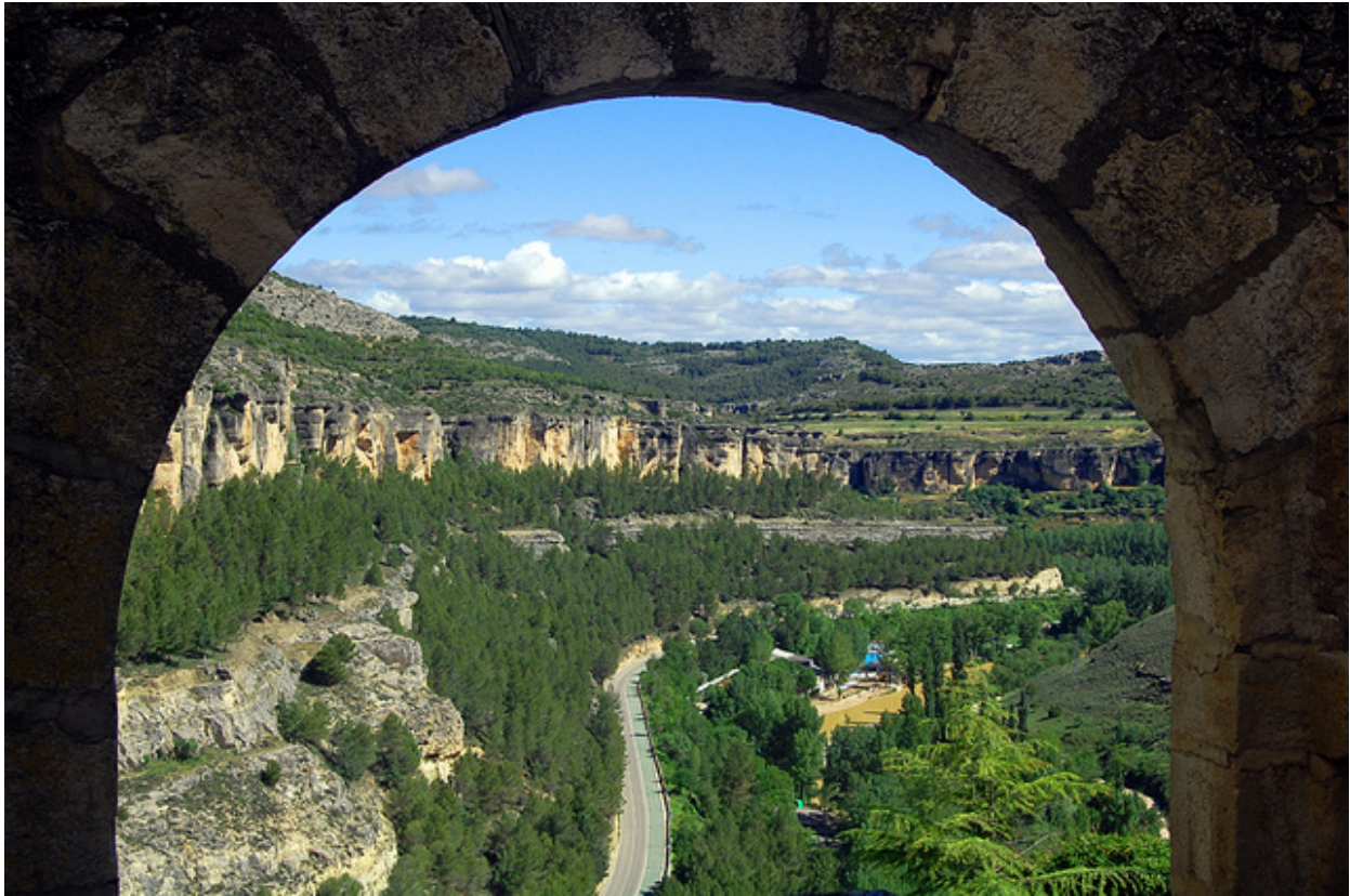
La Hoz del Júcar

En diciembre de 1996, Cuenca y sus hoces fueron declaradas Patrimonio de la Humanidad por la Unesco