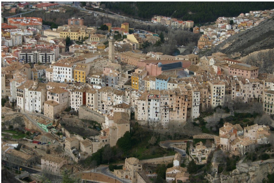
Vista de Cuenca. Los rascacielos, en la Hoz del Hucar

En 1902, se derrumbó el campanario de la catedral conocido como Torre del Giraldo, matando a 6 personas. Tras este hecho, se tuvo que proceder a demoler la fachada barroca y sustituirla por una neogótica, obra del arquitecto Vicente Lamperez, que es la que podemos contemplar hoy en día.