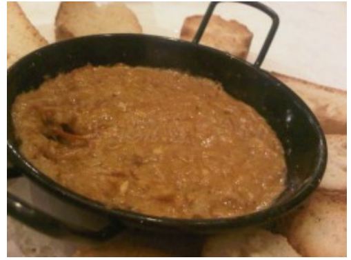
Morteruelo del Buen Lagar