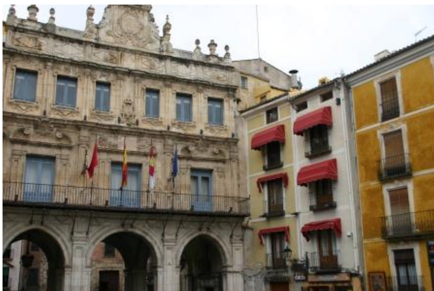
Ayuntamiento de Cuenca

inducen a que somos vigilados por viejos pensamientos del pasado. Lo que llamaríamos fantasmas.