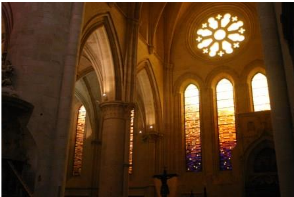
Vidrieras de la catedral

Después podemos ir hacia ver los restos de la antigua alcazaba árabe y pararnos a contemplar como la hoz del Huecar le da un abrazo de enamorado a la vieja ciudad.