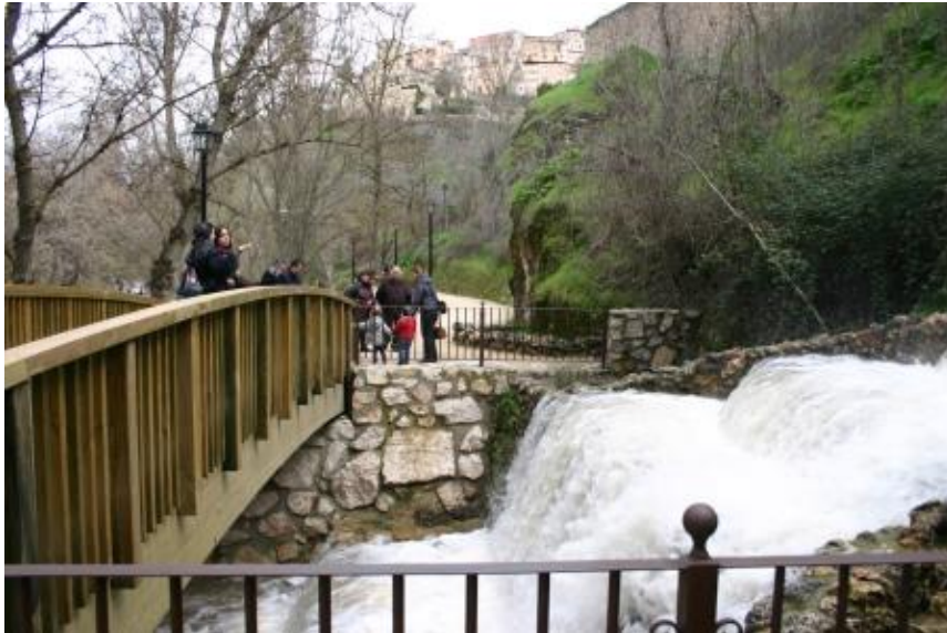
Afluyente del Jucar en Cuenca

duró esta ruta hasta final de los cincuenta con la llegada de baldosas en pavimento la ruta del misterio se mantenía oculta entre pliegues las cumbres de montaña que la protege y desde aquí parado se esconde imaginario