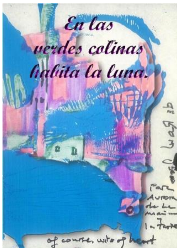
Portada del libro En las verdes colinas habita la Luna