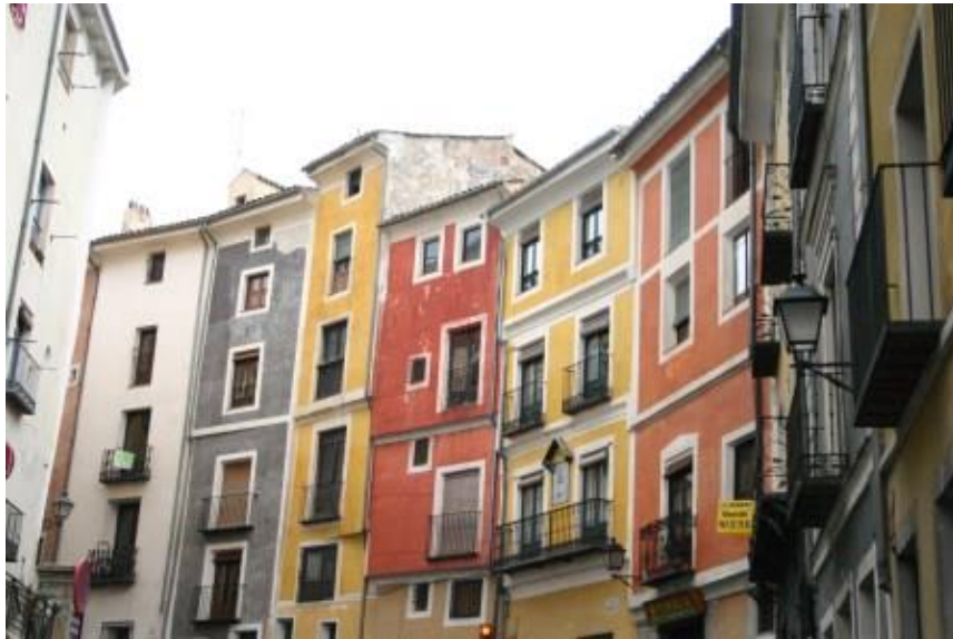
Calle Alfonso VIII

rincones insospechados y te sientes conquistador en una ciudad que la que conquista es ella.