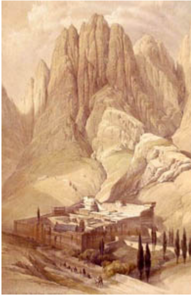
Monasterio de Santa Catalina

Cristina Morató nos dice: “Al igual que la noble Egeria, desde los tiempos más remotos un buen número de mujeres se aventuraron a explorar el mundo aunque la historia –escrita por los hombres– haya olvidado sus increíbles hazañas. Peregrinas, conquistadoras, misioneras, aristócratas inglesas, esposas de exploradores y diplomáticos, se lanzaron allí donde los mapas estaban en blanco contribuyendo con sus viajes a un mayor conocimiento geográfico del mundo. Sin embargo, sus nombres nunca aparecen en los libros dedicados a los grandes hitos de la exploración; ni un monumento ni una triste placa las recuerda en sus lugares de nacimiento o en los escenarios donde llevaron a cabo sus hazañas. Parece que la exploración del ancho mundo, la búsqueda de lo desconocido, fue empresa exclusiva de los hombres. Por fortuna, la otra parte de la historia, la protagonizada por valientes féminas, va saliendo a la luz y nos demuestra que el “demonio” de la