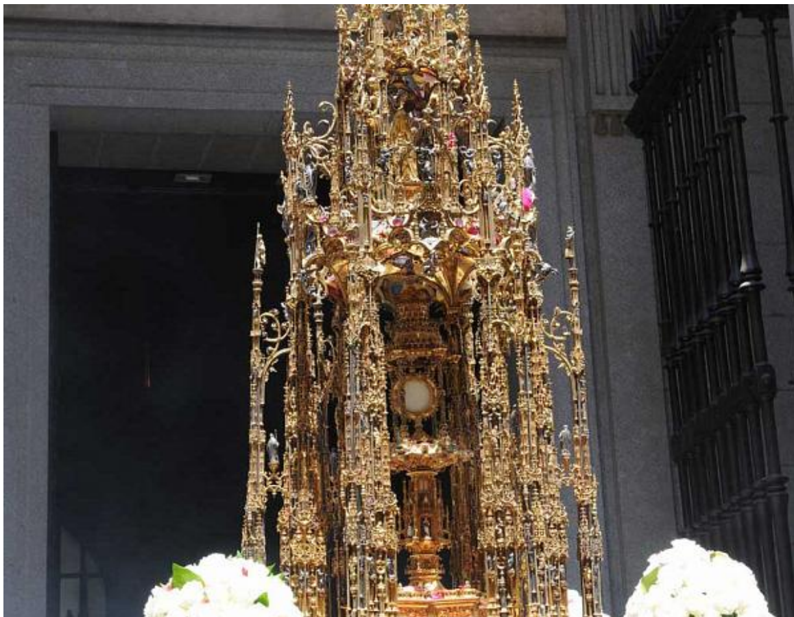
Custodia de Arfe

La Custodia de Arfe surge del noble deseo de fabricar un digno cobijo, más bien un majestuoso trono, para el Ostensorio de Isabel la Católica. El cardenal Cisneros convocó un concurso de proyectos. Y Enrique de Arfe, orfebre alemán que había venido a España en el séquito de Felipe el Hermoso, fue designado para fabricar la Custodia. Como han señalado tantos investigadores repetidamente, el modelo que siguió fue la armónica y esbelta Torre Eucarística del Retablo Mayor. Tardó ocho años y medio en terminar la obra, entre 1515 y 1524.