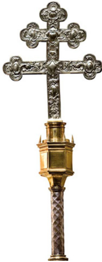
Cruz Cardenal Mendoza

Otra pieza de la época de Isabel la Católica es la no menos célebre CRUZ DEL CARDENAL MENDOZA . En el desfile procesional preside, como guión capitular, a los canónigos y clérigos del Cabildo de la Catedral. Es obra de gran valor artístico e histórico. Su disposición es la propia de una cruz patriarcal, con brazos mayores y brazos menores. Sus medidas son: 55 cm. de altura, 30 cm. los brazos mayores y 20 cm. los brazos menores. Fue labrada en