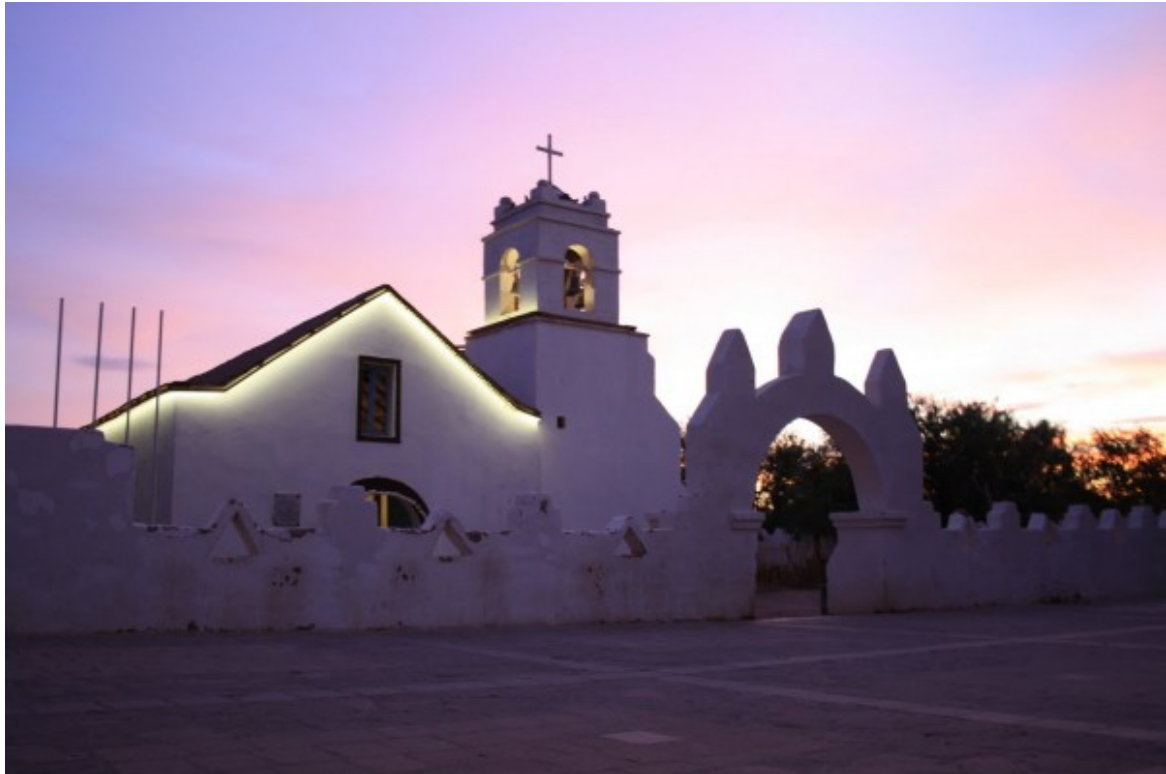
San Pedro de Atacama

San Pedro de Atacama está situado a 2450m de altitud, a los pies de la Cordillera de Los Andes es la puerta de entrada al Desierto de Atacama. Por depender de la actividad turística y ser el punto de partida de variadas excursiones por la región, este encantador pueblo ofrece múltiples servicios a sus visitantes: hostales, restaurantes, Internet, agencias de turismo.