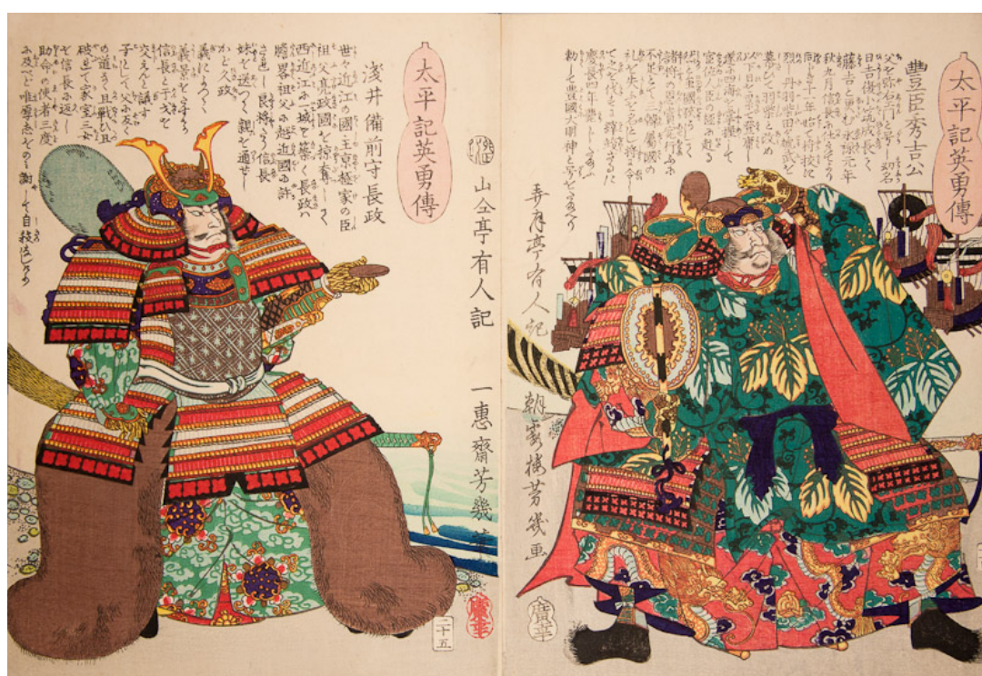
Ilustraciones artísticas de un libro japonés

como una obra de arte en el que el contenido y el mensaje se materializan a través del cuerpo que los sostiene. El tiempo y el espacio a través de la comunicación juegan un papel importante en el mensaje; nos situamos frente al tiempo cronológico de cada artista y el espacio palpable y tangible de cada libro.