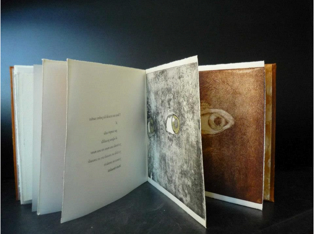
Libro como arte

Un paseo bajo los libros, signos de entretenimiento y ensueño, misteriosos y profundos de deseos ocultos y esperanzas despiertas, anclados en los recuerdos pasados donde las historias de las almas humanas buscan refugio y recorren laberintos de amor y pasión; amarrados