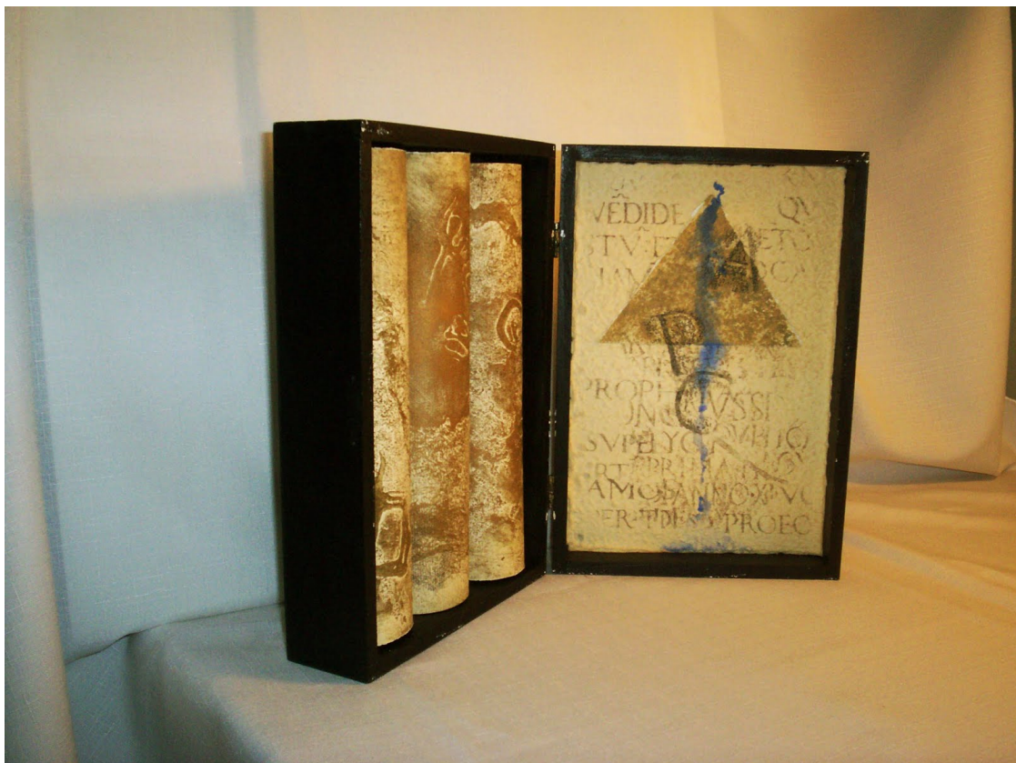
Encuadernación artística de un libro

referirse como recurso que sirve a un fin o como fin en sí mismo. Según Ulises Carrión, se oponen obra y documentación en dos sentidos; por un lado, como documentación artística en la que un libro no posee un valor artístico en sí mismo y en el segundo, la propia documentación es el arte a través del documento.