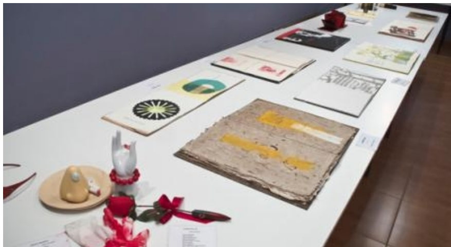
Mesa de un artista ilustrador de libros

En el Discurso sobre el espíritu positivo de Comte, “Nos guste o no, todos somos hijos de nuestro siglo”; nos adaptamos por tanto, a nuestro tiempo y aprendemos, a escribir nuestros libros como si de un acto físico se tratara a través de las nuevas tecnologías y las redes sociales.