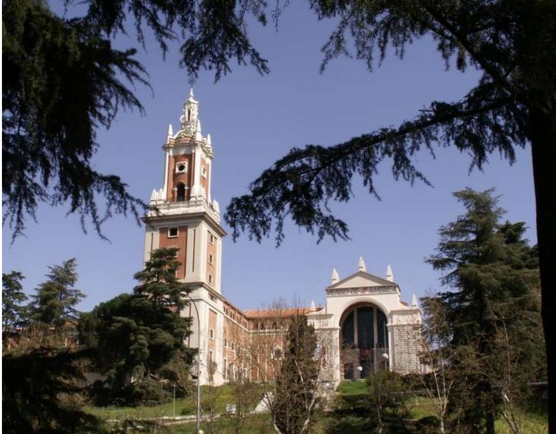
FACHADA MUSEO DE AMÉRICA, MADRID

La ciudad de Madrid cuenta con numerosos atractivos culturales, y no todos están citados en los itinerarios a realizar o incluidos en los paquetes comercializados. Es posible que usted no conozca el Museo de América.