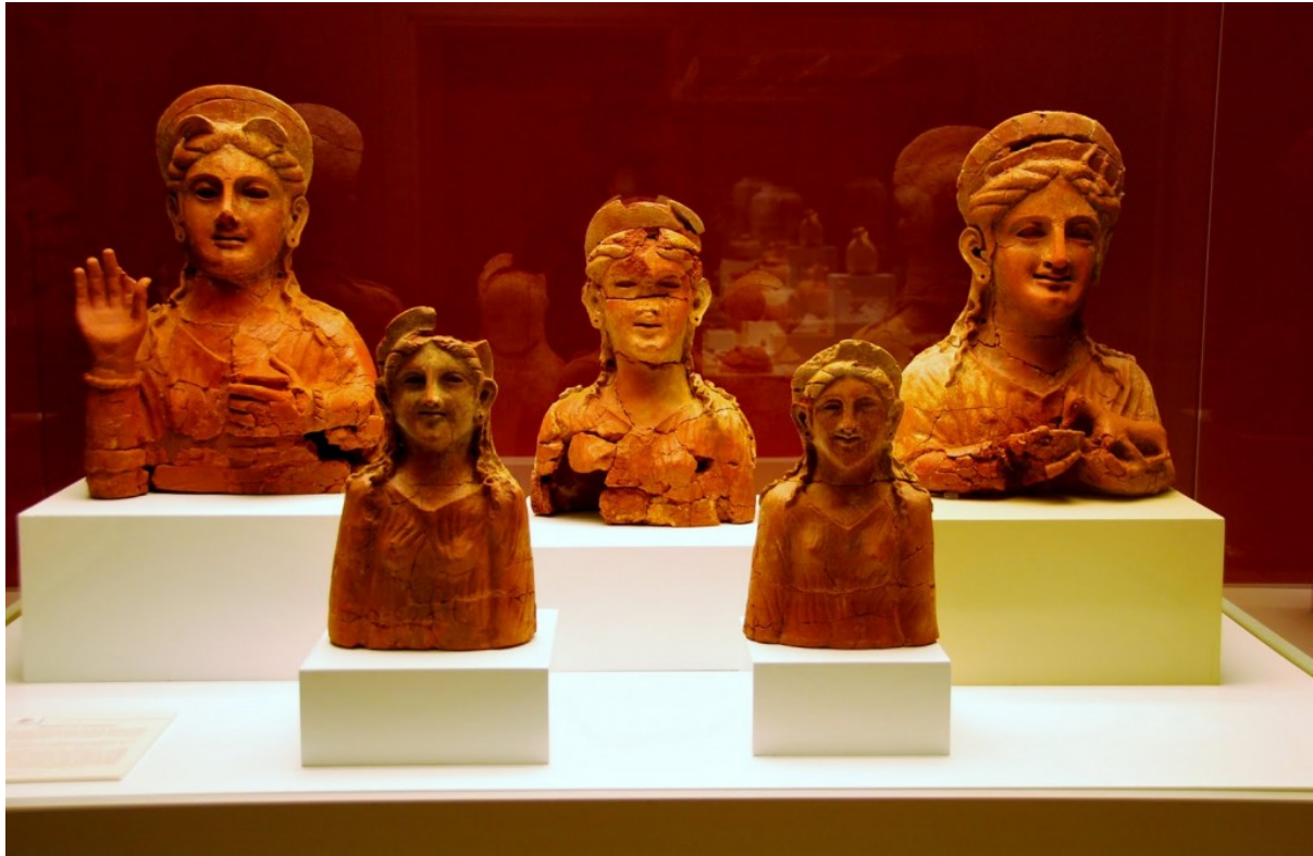
Figuras de terracota romanas

El hallazgo casual en 1887 del sarcófago antropoide fenicio masculino en los terrenos de los Astilleros de Cádiz fue el punto de arranque de la colección arqueológica, lo que justificó la creación de un museo de esta naturaleza en la ciudad, que fue nutriéndose de los hallazgos de las propias excavaciones arqueológicas de aquellos momentos, donaciones de particulares y de los objetos que había reunido la Comisión Provincial de Monumentos Histórico Artísticos, creada a tal efecto por la legislación elaborada por los diferentes gobiernos liberales desde el reinado de Isabel II, tras la Revolución Gloriosa de 1868.