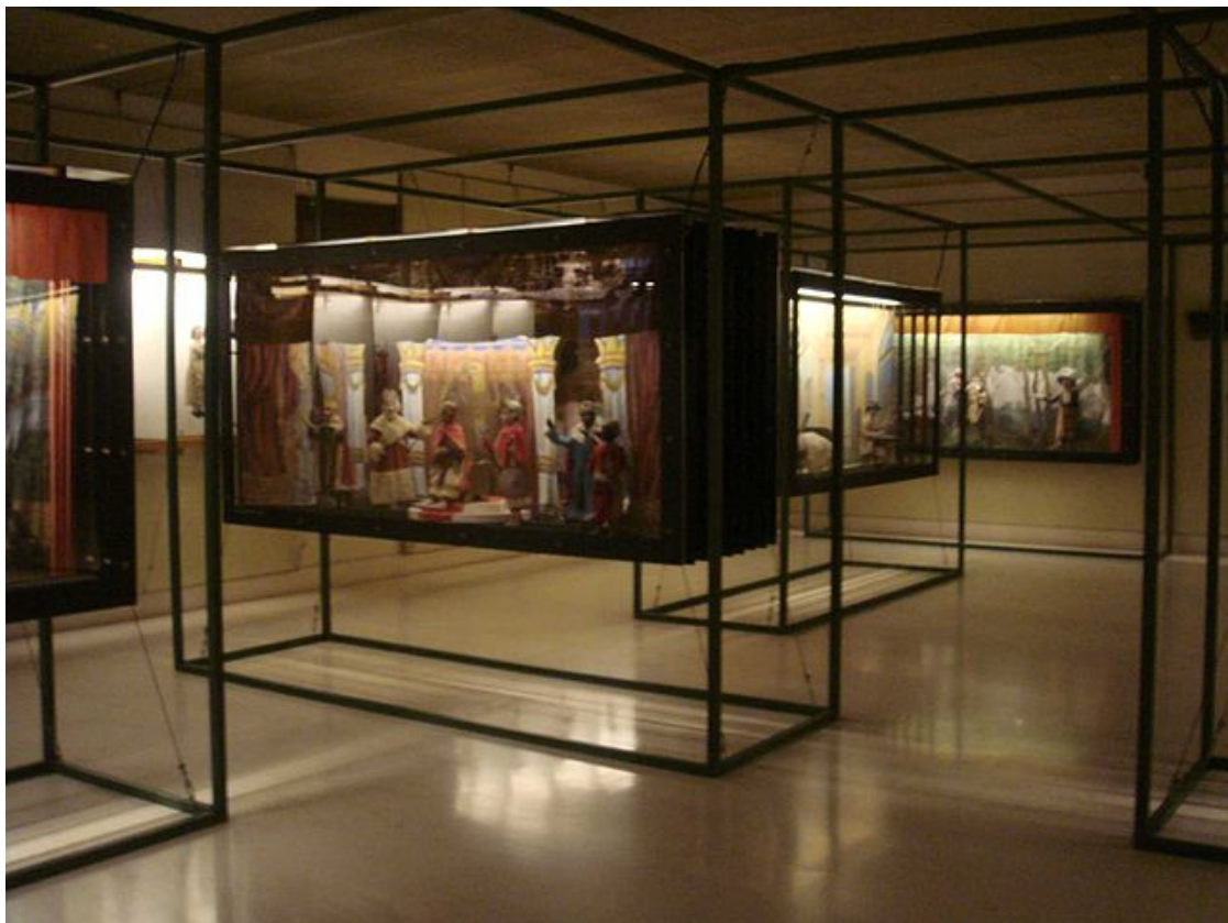
Sala de títeres de la Tía Norica

ubicó en el edificio de la Plaza de la Mina, sede de la Real Academia. Por otra parte, la aparición del sarcófago antropoide fenicio en 1887 hizo que se crease un Museo Arqueológico para custodiarlo. Ambos museos tuvieron trayectorias y destinos distintos a lo largo del tiempo hasta que en 1970 un decreto los refunde a los dos (Bellas Artes y Arqueológico) en este único que se llamó «Museo de Cádiz». A partir de 1980 se inició una profunda reforma en el edificio, a cargo del arquitecto Javier Feduchi. El antiguo edificio de la Academia a la par que en su exterior permanecía inmutable, se transformó íntegramente en su interior, adquiriendo una nueva y original fisonomía. La primera fase de las obras se inauguraba en 1987 y la segunda y última en 1990. Las colecciones de este museo son realmente importantes en Arqueología, siendo de menor interés la sección de Bellas Artes. Cuenta también con sección de Etnología en la que destacan los Títeres de la Tía Norica, tradicionales de Cádiz.