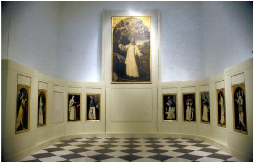
Sala de Zurbarán