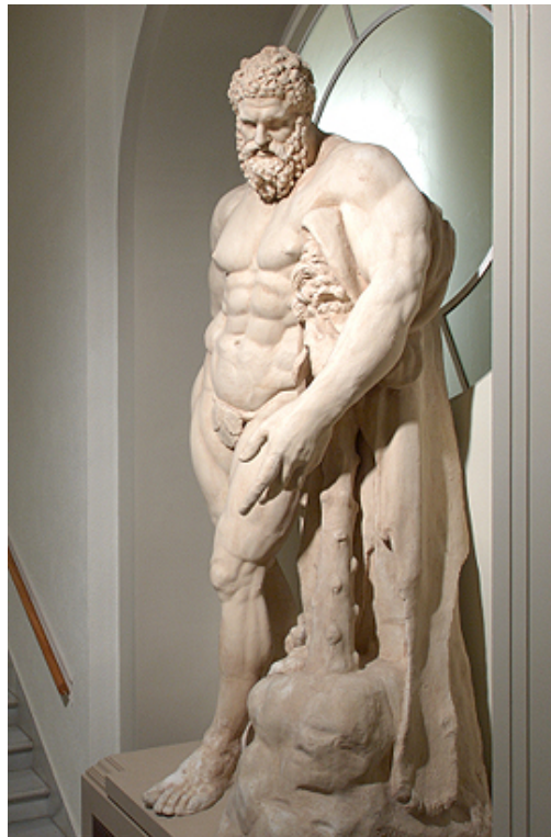
Coloso a la entrada del Museo

Edificio obra del arquitecto Juan Daura en el año 1838, lo comparte con la Escuela de Artes Aplicadas y Oficios Artísticos y la Real Academia de Bellas Artes. La distribución básica se realiza en torno al patio central, organizándose en la planta baja la sección de arqueología, en la que destacan piezas fechadas en el Paleolítico Inferior y otras singulares y únicas tales como los sarcófagos antropóides, los broncees dedicados a Merkart-Hércules o las salas del mundo romano.