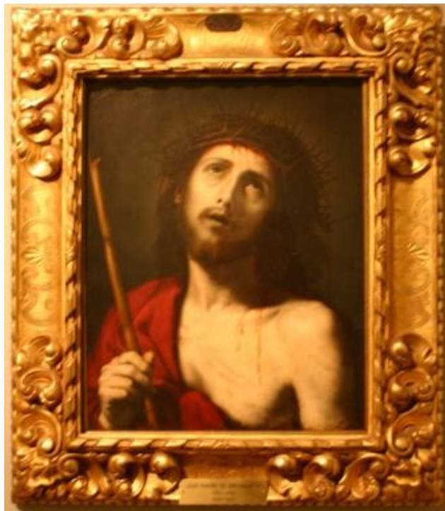
Ice Homo de José Ribera «El Españoleto»

En la segunda planta, contemplamos la Sección de Etnología con los Títeres de la Tía Norica. Finalmente, y en la misma planta, es de destacar la colección de Arte Contemporáneo con obras de: Miró, Chema Cobos, Costus, Pérez Villalta etc.