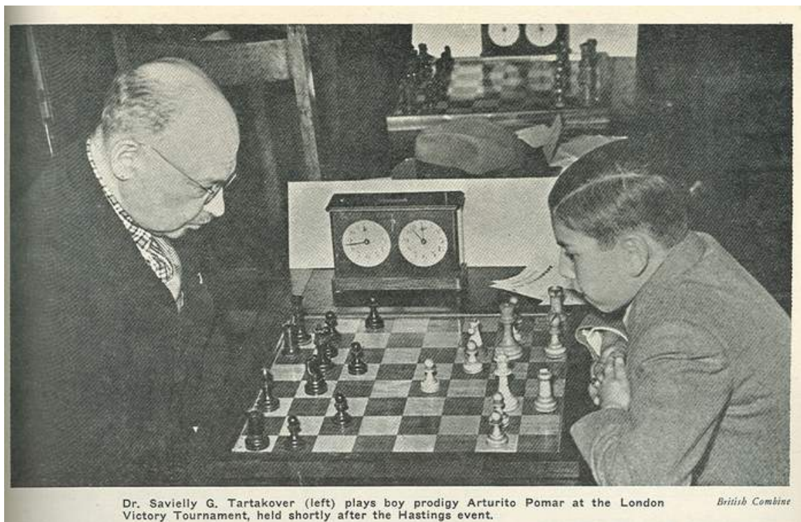
Partid entre Pomar y Tartakover, Londres 1946

Con sólo 8 años ya era capaz de jugar a la ciega, sin ver el tablero ni las fichas, algo realmente increíble. A los 11 años hizo su aparición en torneos de cierto nivel al disputar el Campeonato de Baleares y posteriormente el de España. En ninguno de ellos obtuvo la victoria, pero su presencia levantó una expectación nunca vista en un torneo de ajedrez. Los medios de comunicación se hicieron eco de la aparición de un niño prodigio que jugaba como un maestro curtido y por primera vez el ajedrez apareció en periódicos y televisión. En esa época