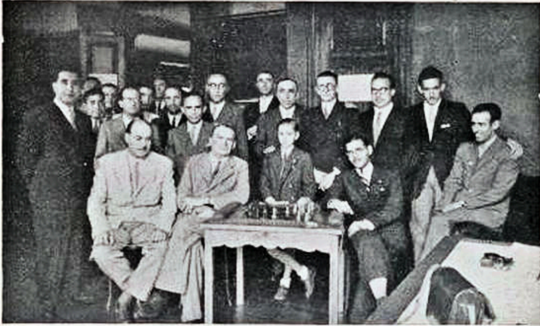
Grupo de los nueve participantes en el Torneo y de los organizadores del mismo.