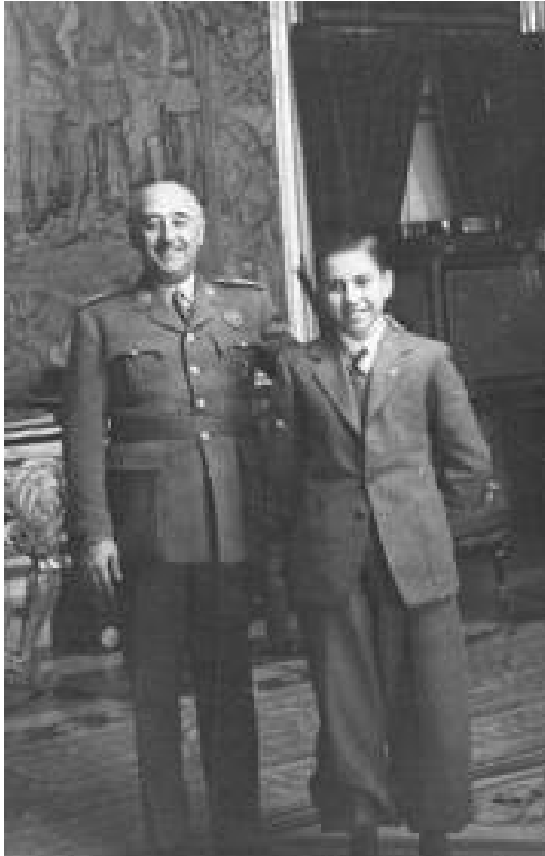
El General Franco con Arturito pomar

Pomar se vio obligado a buscar un trabajo con el que dar sustento a su familia y comenzó a trabajar en Correos, ya que apenas recibía ayudas para poder dedicarse al ajedrez. El franquismo se había aprovechado de la imagen de Arturo de cara al exterior, para luego