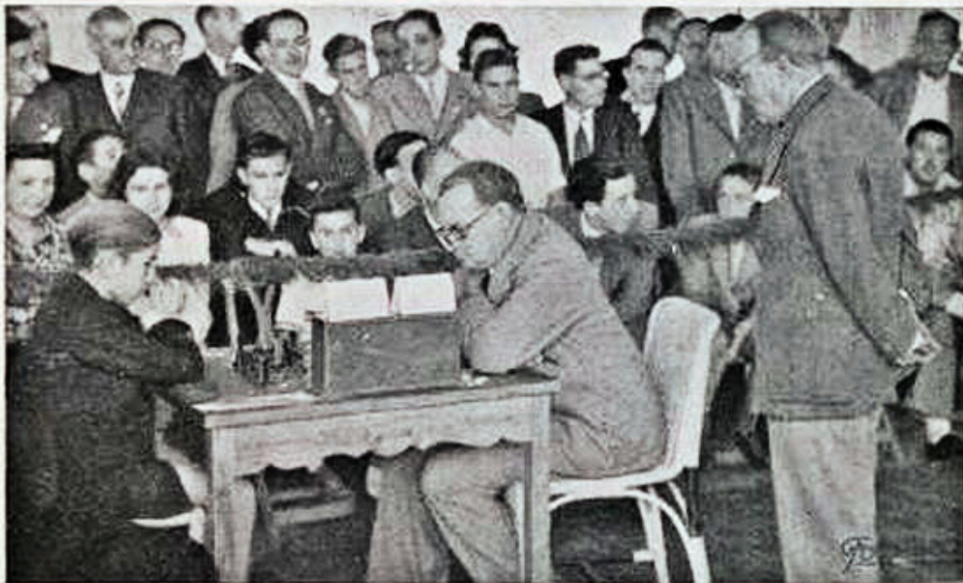
Un momento de la partida Dr. Alekhine-Pomar, presenciada por el gran actor D. Ricardo Calvo.

Partida entre Pomar y Alekhine. El observador e el actor Ricardo Calvo