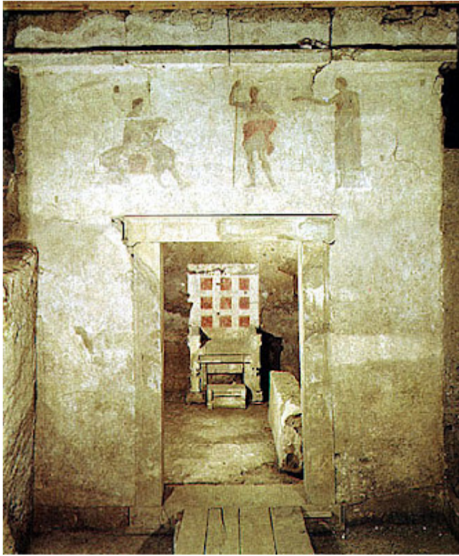
Tumba de Filipo II, padre de Alejandro Magno

Náutico, donde se puede observar un recorrido por la historia de la anvegación, considerando la tradición náutica de los griegos, narrada, por ejemplo por Homero en la Odisea, que, en el fondo, es el periplo de Ulises por el Mediterráneo