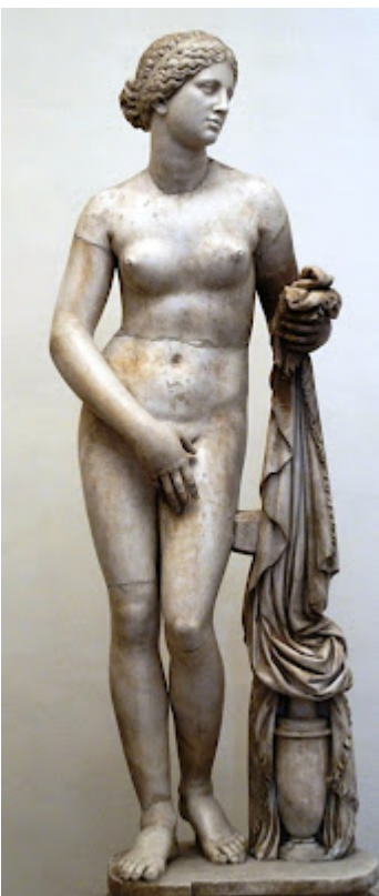
Afrodita de Cinido

El monte Olimpo era para la mitología griega” el hogar de los dioses olímpicos”, los principales dioses del panteón griego presididos por Zeus: “Los griegos creían que en él había construidas mansiones de cristal en la que moraban los dioses”. Estos eran en principio: Zeus, Hera, Ares, Hefesto, Artemio, Apolo, Atenea ,Hermes, Afrodita, Démeter, Hestia y Poseidón.