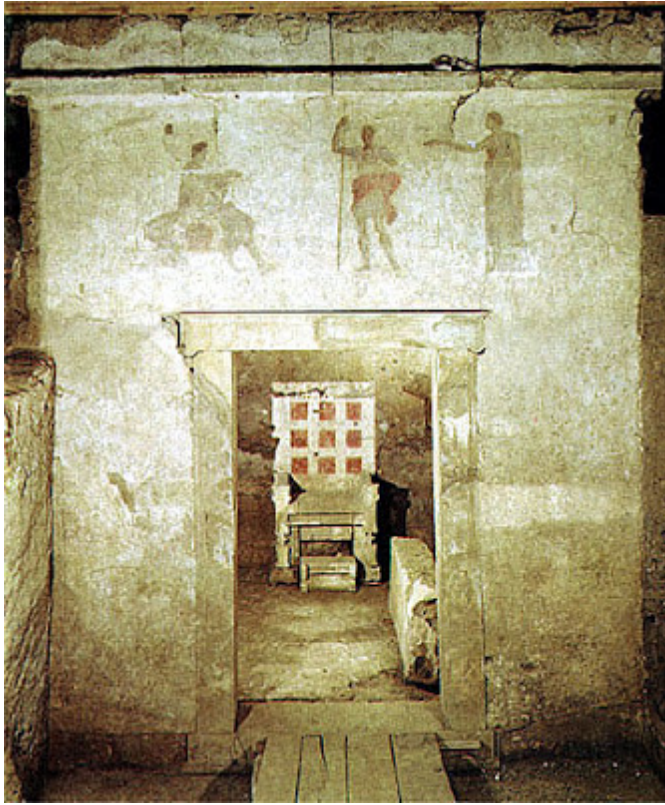
Tumba de Filipo II, padre de Alejandro Magno

Náutico, donde se puede observar un recorrido por la historia de la anvegación, considerando la tradición náutica de los griegos, narrada, por ejemplo por Homero en la Odisea, que, en el fondo, es el periplo de Ulises por el Mediterráneo