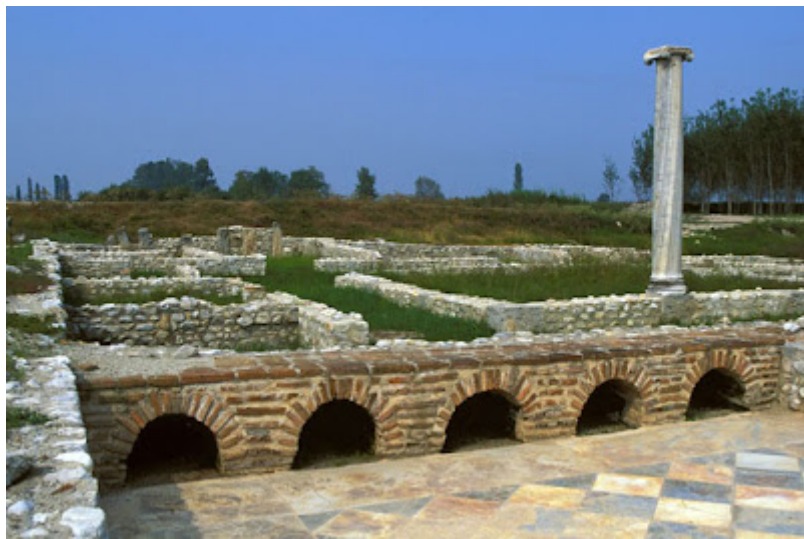
Ruias de Dion

En los alrededores de Salónica merece la pena visitar Dión , pueblo situado en la falda del Olimpo, a diecisiete kms al sur de Katerini. Tiene un gran recinto arqueológico que abarca una extensión de terreno bastante considerable, por donde transcurre un río ("gran parte del recinto está sumergido en un lago"), donde el canto de las ranas y las cigarras en verano son testigos de la impresionante historia del lugar.