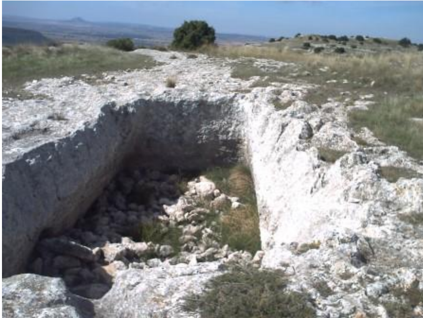
Almacén de grano excavado en la roca

Los romanos lo llamaron Puteolum, por la gran cantidad de aljibes que hay en el lugar.