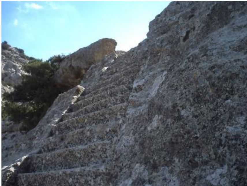
Escaleras excavadas en la roca

monumento. En esa zona nos encontramos con la fuente, con su caño original que ha sufrido una modificación, y en la que se aprecian unas escaleras excavadas de época ibérica, y algo más abajo el aljibe.