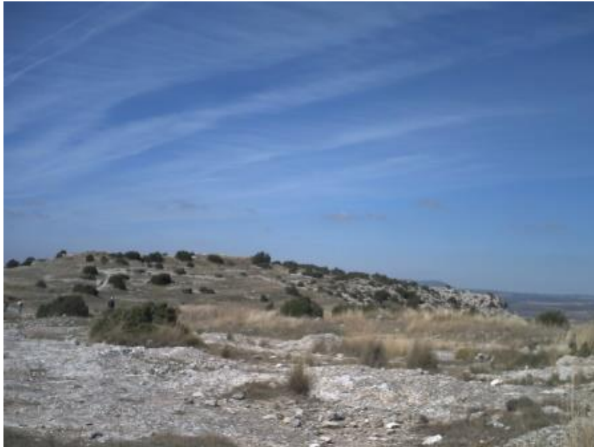
Meseta donde está situada el Castellar de Meca

El Castellar nos muestra desde su principio la importancia que ha tenido en la historia, en su historia. Poblada en la época de la edad del bronce, nos enseña, nos deleita con su visión la esplendor de sus tiempos repletos de historia. Una ciudad en lo alto de una cima que pertenece a la Sierra del Mugrón, pudo albergar a más de 10.000 almas. Posiblemente en sus principios fue ocupada por los íberos, luego, tras seguramente cruentas batallas, pasó a manos de los romanos, como así muestran sus piedras, y después llegaron los árabes para a posteriori dejarlo en el