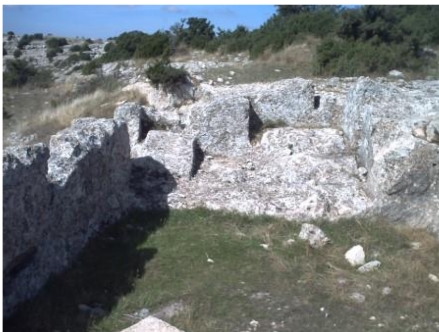
Vivienda excavada en la roca

En épocas de depresión por malas cosechas o crisis, la defensa del lugar y sus recursos excedentarios almacenados en periodos de bonanza sería fundamental. Estas clases ibéricas dirigentes y un sistema económico bien organizado serían la base del desarrollo de la cultura ibérica del siglo V-III a.C. con su capacidad de crear monumentos funerarios, ricas necrópolis, santuarios y escultura, característicos de la zona.