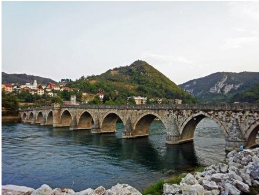
EL PUENTE SOBRE EL DRINA.

Pero el más famoso es el puente sobre el Drina, en Bosnia, sobre el cual el gran escritor Ivo Andric escribió su famosa novela . Está en Visegrad, en la república serbia de Bosnia, en el corazón de la antigua Yugoslavia. Construido por orden de un visir turco de origen bosnio, unía oriente y occidente, lo turco con lo austriaco. Allí la joven Fata se tiró al agua para escapar del fanatismo paterno que la sojuzgaba y la obligaba a casarse con un hombre al que no amaba. Al lado en el edificio donde estuvo el Hotel Lottica , buscábamos el fantasma de la tía Lotte , la judía