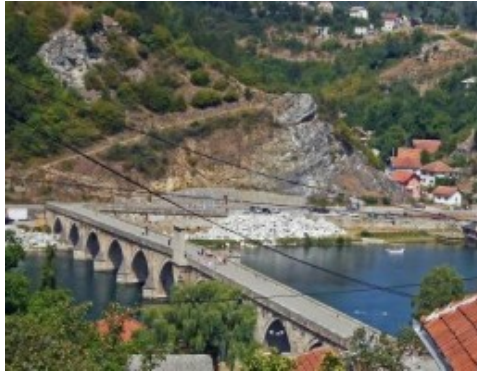
EL PUENTE SOBRE EL DRINA

Yugoslavia estaba llena de puentes. Era un país lleno de montañas, abismos y diferencias culturales y los puentes eran muy necesarios. Muchas películas y novelas hablan de puentes que se construyen o se destruyen. Consuelo y yo visitamos algunos d esos puentes.