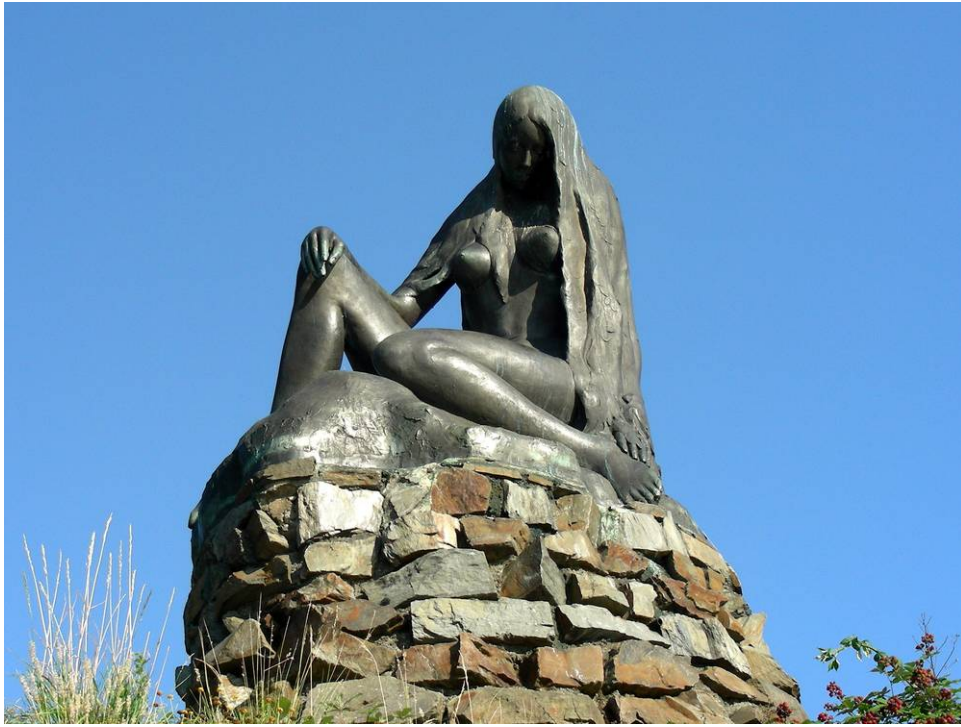
Monumento a la sirena Loreley