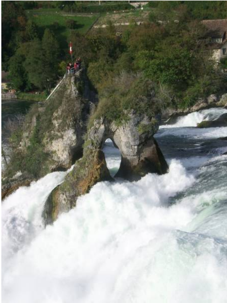
Cataratas del Rin

Presente y varad en el pasado, pero no el barco que se mueve por un Rin que nos lleva, eso nos dice el guía, hacia su tramo más romántico. (¡Dios mío, pero si ese tramo está en mi corazón y ahí no llega más barco que el del amor aquilatado en el taller de los años!...)