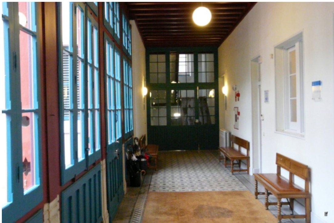
Interior del hospital