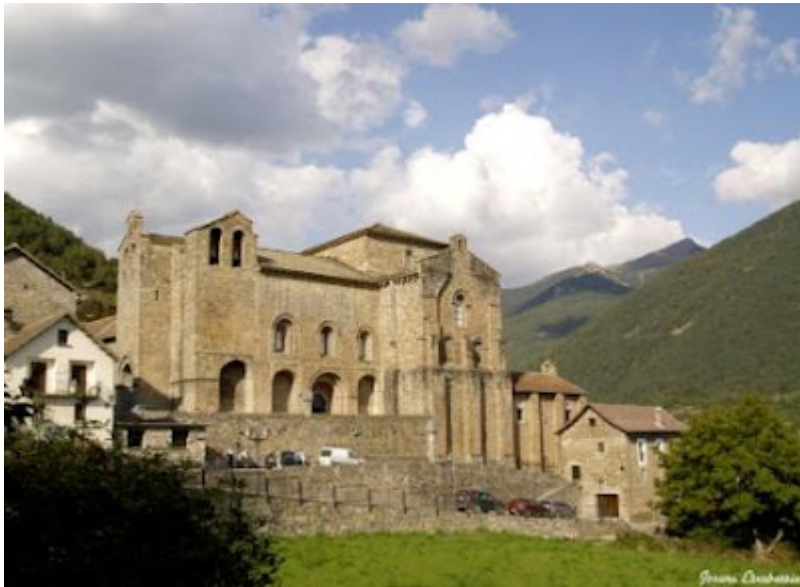
Monasterio de San Pedro