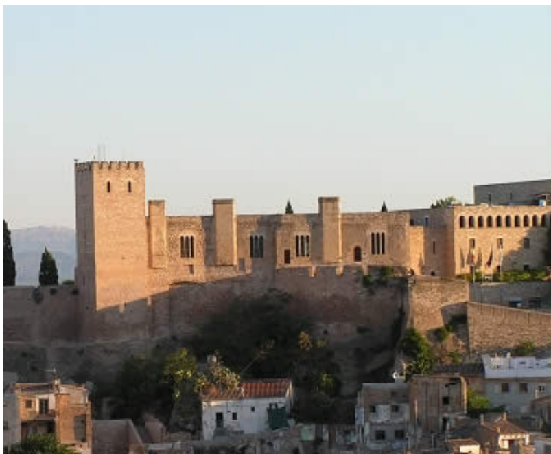
Fortaleza de Tortosa

(elegido a tal fin), en hijo, quien ejercería los derechos reales del primero. El que sobreviviese, heredaría al otro. Este acto (Pacto de Vadoluengo, enero 1135) permitía seguir unidas a Aragón y Navarra. Fracasó, debido que el navarro rompió el convenio mientras estallaba una revuelta nobiliaria en Aragón que obligó a Ramiro a exiliarse (suceso de la “Campana de Huesca”, reprimido rigurosamente).