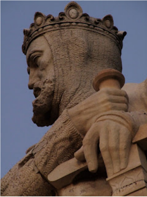
Alfonso I el Batallador

Su extensión territorial a lo largo de seis siglos de vigencia[2], varió. Su núcleo primordial siempre lo integrarán los reinos de Aragón y Valencia[3] y el condado de Barcelona, dominios a los que se adherirán otros, esporádicamente, como el reino de Mallorca. El ocaso de esta potencia marítimo-militar, base de la expansión hispana en el Mediterráneo[4], se verifica en los umbrales del s.XVIII, secuela directa de la Guerra de Sucesión Española y la implantación del Estado centralista borbónico, de sello francés. Prevalece de este modo abrupto, el poder de la Monarquía Absoluta sobre el viejo foralismo de origen medieval.