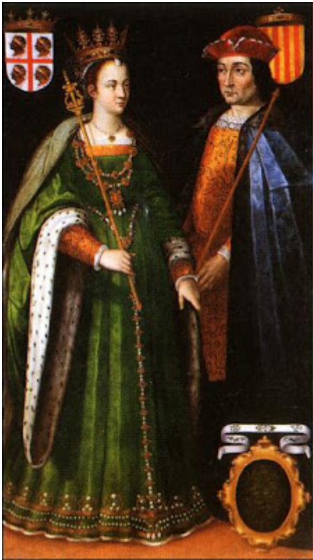
El Conde Ramón Berenguer y Petronila de Aragón

Castilla se hizo cargo del dominio García Ramírez de Navarra, vasallo de Castilla.