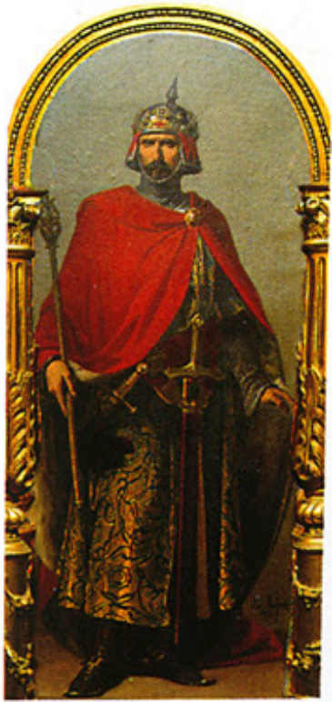
Ramirez El Restaurador

Alfonso, concentrado en los preliminares del ataque a Fraga, Lérida y Tortosa, plazas desde donde los almorávides podían hostigar Zaragoza (ocupada por el Batallador entre 1118 y 1120), firmó un primer testamento durante el sitio de Bayona (1131), renovado por un segundo en Sariñena poco antes de su óbito (8 septiembre 1134), tras la derrota cristiana en Fraga (julio 1134), donde fue mortalmente herido[11]. Moría sin descendencia creando un problema dinástico, agravado por la complejidad de sus últimas voluntades[12] (que beneficiaban ampliamente a las Órdenes Militares).