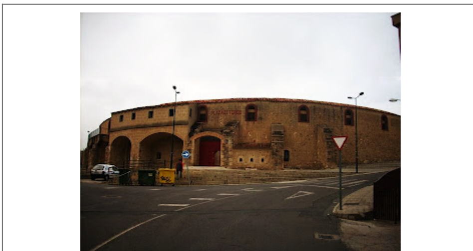
Plaza de toros de Plasencia

La construcción de la plaza de toros de Plasencia fue acordada en 1882, un año después de que fueran instauradas las ferias por el Ayuntamiento en el mes de mayo. Fue levantada en terrenos del Cotillo de San Antón por una sociedad de placentinos creada al