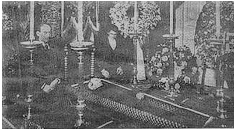
Frascuelo en su última morada

La preocupación del pueblo madrileño al conocer el estado de salud de Frascuelo fue tal que incluso Alfonso XII, gran admirador del torero, ordenó que llenaran de arena la calle en la que vivía la hija de "Frascuelo" para que el ruido de las ruedas de los carros al pasar por el adoquinado, no molestaran al torero moribundo.