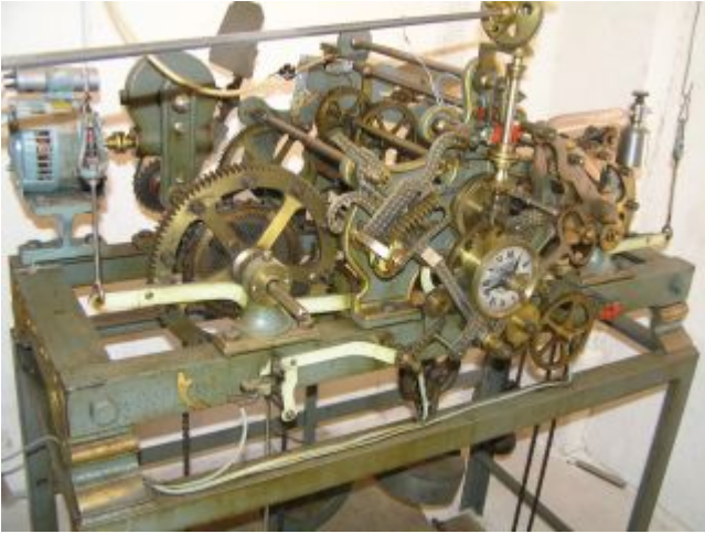
Maquinaria del reloj

La campana de los cuartos es obra del fundidor Joaquín Balle, está fundida en el año 1572, con un peso de 60 kilos y un diámetro de 47 centímetros. Presenta una breve epigrafía gótica, «+ ihs maria tedeum laudumus fedomi». De la cual el inicio se corresponde a la abreviación de nombre de Jesús en griego seguido del nombre de María, continuando en latín con un trozo del Te Deum. La campana se encuentra rodeada de una inscripción en mayúscula gótica que dice; «.+ SAGELL # DELA # BILA # DE # ELG # «.