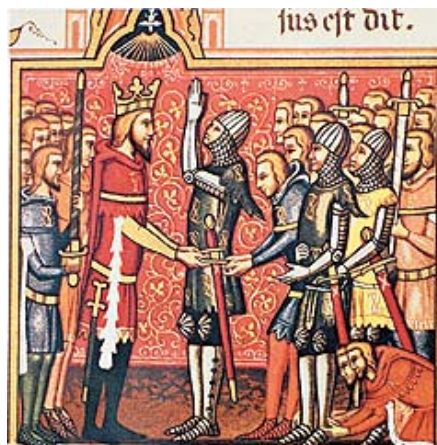
Roldán con su tío Carlomagno