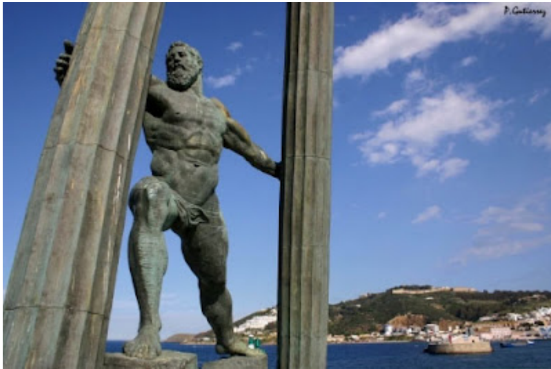
Monumento a Hércules en el puerto de Ceuta

La narración que hace la mitología de los doce trabajos encargados al semidiós Hércules y consecuentemente de las proezas llevadas a cabo por éste para alcanzar el triunfo en cada uno de ellos, describe los portentos realizados por el héroe mitológico, hijo de Zeus dios del cielo y de Alcmena, mujer mortal casada con Anfitrión. Los encantos de ésta habían seducido al dios quien, vencido por la tentación y mediante una estratagema, consiguió yacer con ella germinando su vientre, con evidente disgusto de Hera, la reina del Olimpo.