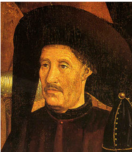
ENRIQUE EL NAVEGANTE

influencia ejerció sobre él el florentino Paolo del Pozzo Toscanelli (1397-1482), quién defendía la viabilidad de una navegación hacia la China por el oeste, con la facilidad añadida de poderse hacer escalas en la mítica isla de Antilia y en Cipango (Japón)? ¿Por qué y cuantas veces le fue rechazado su proyecto, en Portugal, España e incluso Francia? ¿Cuáles fueron los auténticos motivos por los que los Reyes Católico apoyan su proyecto y en qué razones basaron sus concesiones a Colón? Y lo que más nos afecta a nuestro trabajo: ¿Hizo uno o dos viajes al Monasterio de La Rábida? ¿Qué personajes pudieron apoyarle de cara a los Reyes Católicos? ¿Por qué motivo se dirigió Colón al Monasterio de La Rábida en la idea de ofrecer su proyecto a los Reyes Católicos? ¿Fue el Descubrimiento de América consecuencia de un error de cálculo?