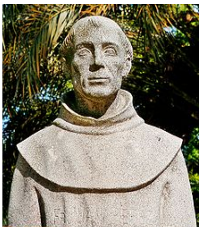
FRAY JUAN PÉREZ

En el segundo viaje al Monasterio de la Rábida en 1491, Colón encontraría otro personaje fundamental: fray Juan Pérez , que había sido confesor de la reina Isabel la Católica , y que también le presentaría a la abadesa del Monasterio de Santa Clara, Inés Enríquez , tía del rey Fernando el Católico , quién también jugó un papel protagonista en la aceptación del plan colombino por parte de los monarcas. Los reyes recibieron a Colón, acompañado de fray Juan Pérez, en Santa Fe y le proporcionaron una nueva ayuda económica, y pese al pronunciamiento negativo de la nueva Junta, los valedores de Colón consiguieron de los reyes una rápida contraorden, comenzando las negociaciones sobre la expedición, que