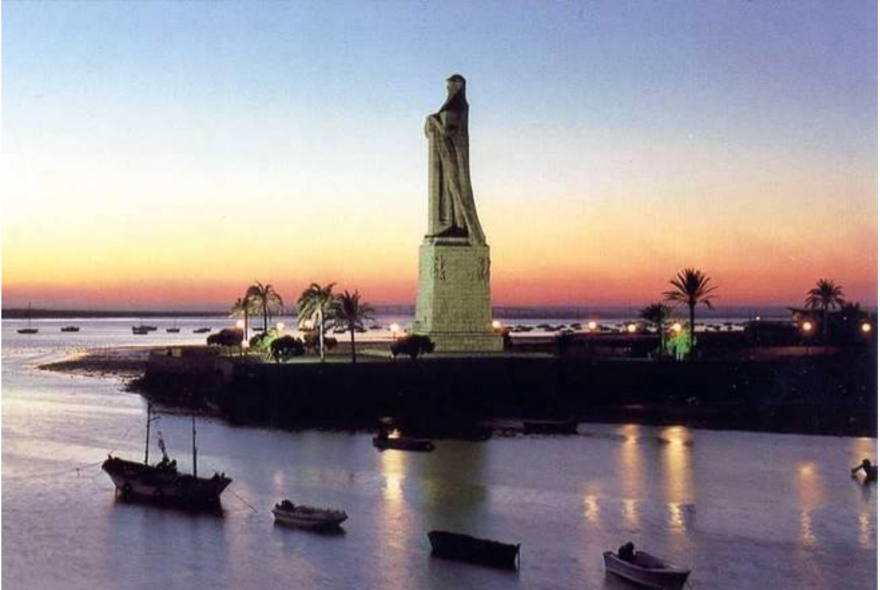
MONUMENTO A LA FE DESCUBRIDORA

“En la margen izquierda del rio Tinto , cerca de su desembocadura, se encuentra una zona de terreno realmente privilegiada...El paisaje es de una singular belleza de extensos pinares abiertos a la intensa luminosidad del mediodía... La historia adquirió resonancia universal en este bello rincón andaluz... En él se encuentran enclavados los pueblos de Moguer y Palos de la Frontera y el Monasterio de la Rábida , cuyos solos nombres bastan para evocar una de las mayores gestas históricas: El Descubrimiento de América ... Historia y arte alcanzan en estos lugares una maravillosa conjunción, y así, según la tradición, en la iglesia de Santa Clara de Moguer, oró Cristóbal Colón , antes de su salida a las Indias; en la de