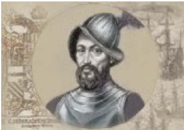
Diego García de Herrera

Pero la historia de nuestra presencia allí hay que situarla mucho antes, cuando la Monarquía Católica, esencialmente gracias a la visión geo-estratégica de la reina Isabel, consciente de la necesidad de mantener en tierra firme una retaguardia que asegurase la permanencia de nuestras armas en las Islas Canarias, punta avanzada de Castilla en el Océano Atlántico, animó a sus capitanes a efectuar expediciones por las costas occidentales del norte de África, próximas a dichas islas.