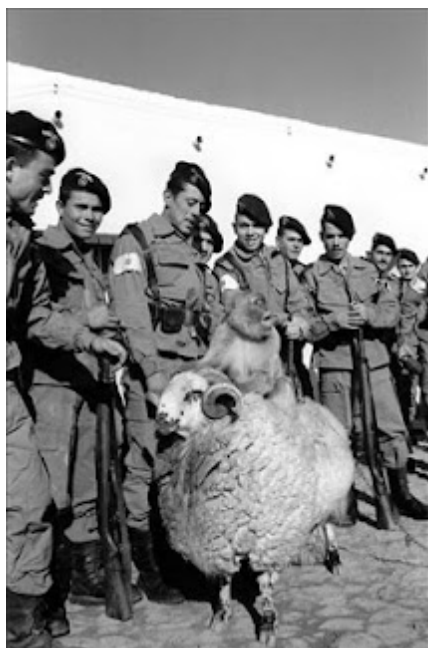
Soldados en Ifni

partido político Al Istiqlal , presentando una larga lista de reivindicaciones soberanistas que alcanzan a los territorios por entonces de España, anima a las masas a la recuperación de los mismos. Una serie de “bandas armadas incontroladas” del que llamaban Ejército de Liberación, imbuidas de un exacerbado espíritu nacionalista, apoyadas por la Unión Soviética a través del FLN y a la llamada de la yihad –guerra santa del Islam-, a finales del año 1957 y principios del año siguiente, desencadenaría una serie de ataques feroces a las posesiones españolas de Ifni y Sáhara.