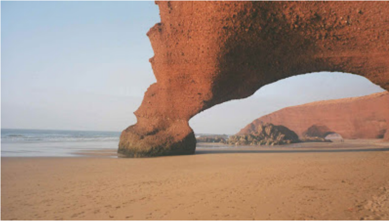
Playa de Ifni

El agreste territorio de Ifni, situado en la costa atlántica, al suroeste del actual reino de Marruecos, y frente al archipiélago de las Canarias, está comprendido entre las llanuras de Tiznit, al norte, y la del Nun al sur de la cordillera del Anti Atlas. Los derechos de posesión por parte de España, reconocidos internacionalmente, se remontan a la firma del tratado de Tetuán en 1860, tras la victoria de nuestras armas en la batalla de Wad-Ras .