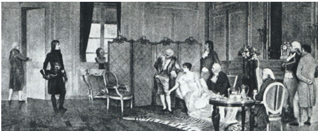
Encuentro de Napoleón y de Josefina Cuadro de Jules-Georges Bondoux

club de los jacobinos. Pero, como en tantos otros personajes, los ideales de la rebelión se volvieron en su contra ya que resultó guillotinado durante el período del Terror.