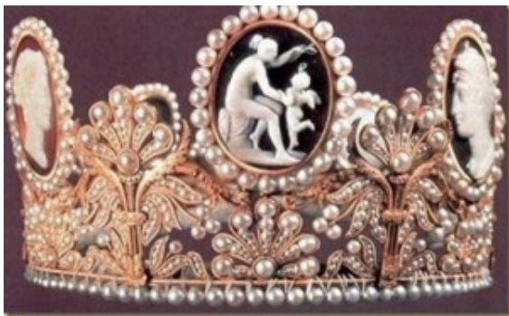
Tiara de Josefina

Ante las ausencias del nuevo esposo, Josefina aprovechó para mantener amantes, incluyendo a un teniente húsar llamado Hippolyte Charles. Los rumores de la infidelidad llegaron a oídos de Napoleón a través de sus hermanos y amigos. José Bonaparte ya había tratado de disuadirlo de la boda. Al regresar de la expedición a Egipto, expulsó a Josefina de su casa si bien él continuó con sus amoríos con la criada Elisabeth de Vaudey o con Pauline Bellisle Foures, conocida como la «Cleopatra de Napoleón».