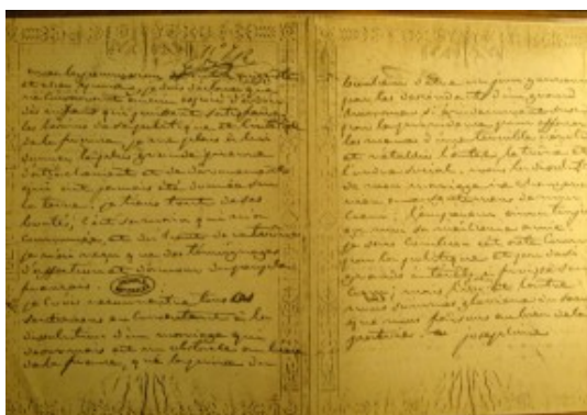
Carta de divorcio entre Napoleón y Josefina

código y, al año siguiente, el emperador contrajo matrimonio con la archiduquesa María Luisa de Austria, hija de su rival Francisco I. El 20 de marzo de 1811 dio a luz a Napoleón II. No obstante, andando el tiempo, el hijo de Hortensia llegó a ser Napoleón III y, Josefina, la hija de Eugenio contrajo matrimonio con el rey Óscar I de Suecia.