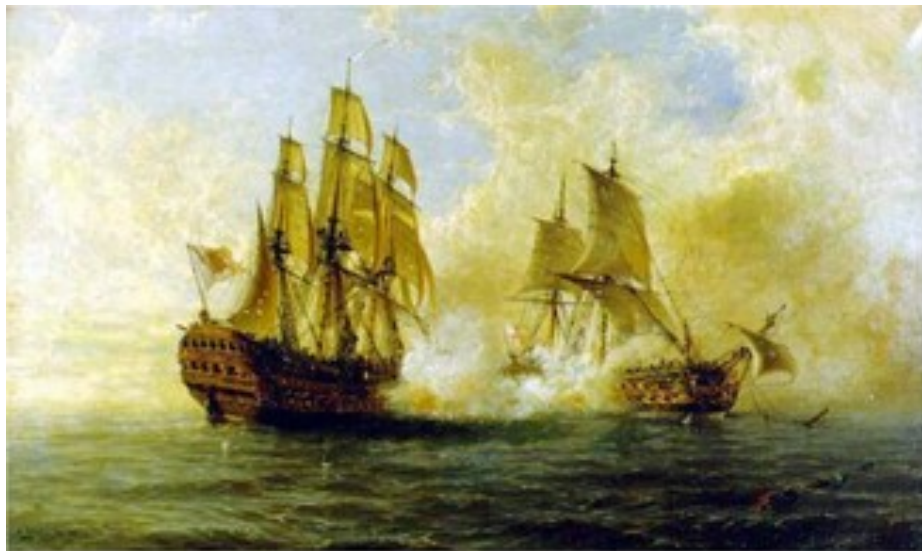
Combate del Glorioso con el Darmouth

Cerda, vio hasta el anochecer y de nuevo hacerse el día sin dejar de presentar batalla. Sin municiones, con el casco literalmente destrozado y los aparejos inservibles, el Glorioso entregó las armas el 19 de octubre de aquel año de 1747, después de haber causado grandes destrozos en todos sus oponentes. Los españoles vendieron caro su pellejo.