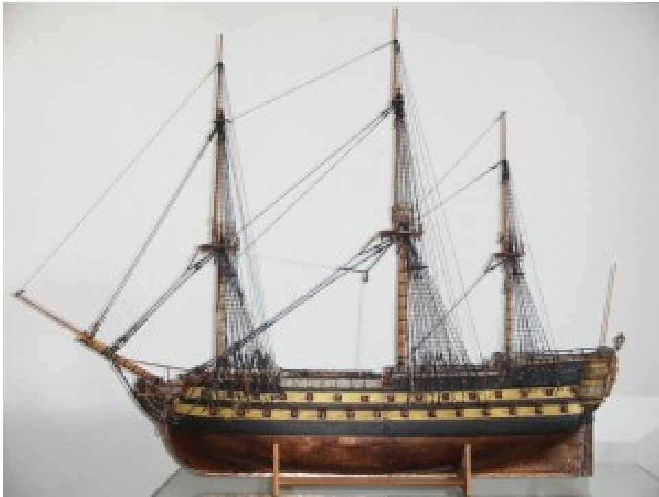
Maqueta del Glorioso

En 1747 reina Fernando VI, el segundo Borbón. España ya no es el imperio invencible de antaño, pero es todavía una gran potencia. Después de que el almirante inglés Vernon, sufriera la más desonrosa derrota a las manos del almirante español Blas de Lezo en el asedio a Cartagena de Indias, o después de la poco conocida historia del