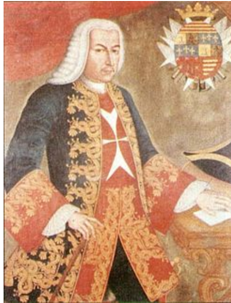
Don Pedro Mesía de la cerda

Tras ser liberado, por sus merecimientos y el heroísmo demostrado, don Pedro Mesía de la Cerda fue ascendido a Jefe de Escuadra, llegando a ser Teniente General y Virrey de Nueva Granada. Murió en Madrid un 15 de abril de 1783.