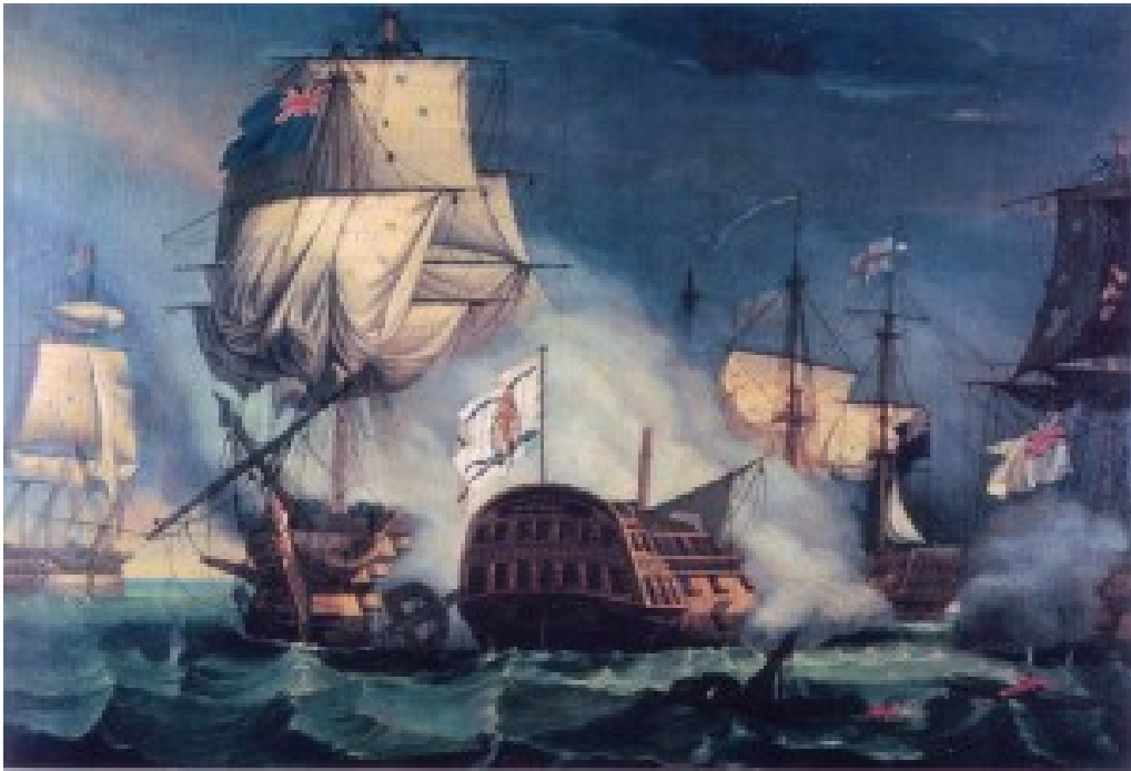
Combate final del Glorioso

de andanada a todos sus contendientes, excepto al último, un poderoso navío de tres puentes, pero eso no mengua en nada el valor y la destreza con que combatió.