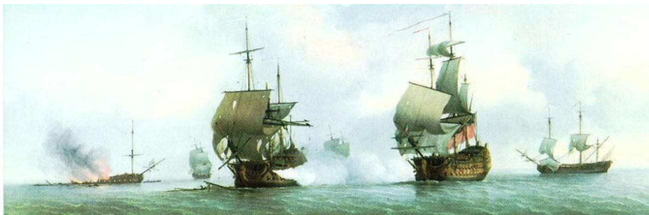
Combate del Glorioso con el Rusell