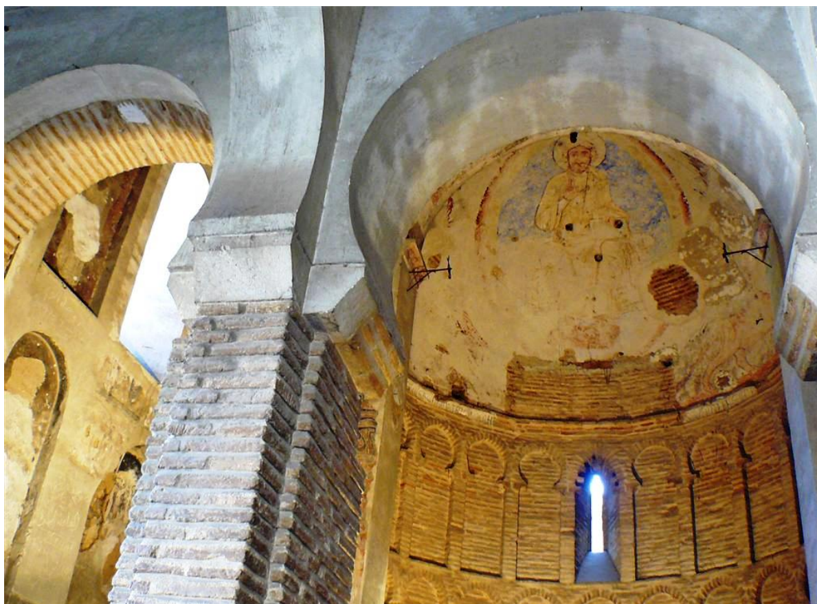
Ermita Cristo de la Luz

La antigua Mezquita de Bib-al-Mardum, o de Valmardón, también conocida como Mezquita , Iglesia o Ermita del Cristo de la Luz, está situada a la entrada de la ciudad por la Puerta de Bib-Al-Mardon. Es una de las joyas del arte islámico en la Península Ibérica. Se trata de la mezquita mejor conservada de las diez que existieron en Toledo en la época musulmana. Estaba