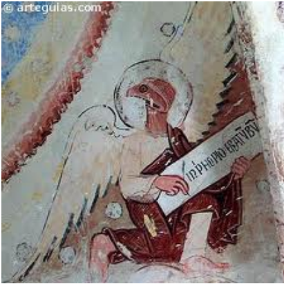
Detalle de una de las pinturas.

Tiene planta cuadrada y tres cuerpos, la fachada es de ladrillo decorada con arquerías que recuerdan a la mezquita de Córdoba. En el interior los arcos de herradura sostienen nueve bóvedas, siendo su traza diferente en los distintos tramos de la nave. Cuando se consagró al culto cristiano, se añadió el crucero y un ábside de estilo mudéjar decorado con arcos ciegos. Conserva frescos del siglo XIII, como un pantocrátor, santos, tetramorfos y un clérigo con maza.