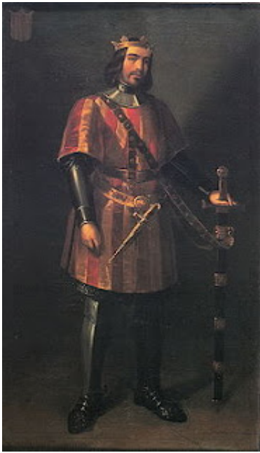
Fernando I de Aragón

Al morir Fernando I el Magno, en 1065, - considerado el fundador del reino de Castilla y de la monarquía castellana, aunque el primer rey fue su hijo Sancho II, dividió sus reinos entre sus hijos. Al primogénito Sancho le dejó Castilla y las parias de la taifa de Zaragoza. A su favorito Alfonso le dejó el reino de León, correspondiéndole el título imperial así como los derechos de la taifa de Toledo. Su otro hijo García recibió el reino de Galicia y los derechos sobre las taifas de Sevilla y Badajoz. A sus hijas Urraca y Elvira les correspondió las ciudades de Zamora. y Toro, también con dignidades de realeza. A su muerte se produce una guerra fratricida entre sus hijos.