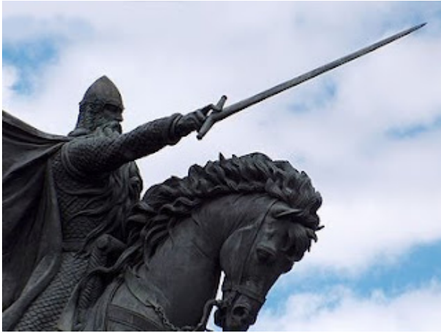
Monumento del Cid en Burgos

La denominada Jura de Santa Gadea fue un acontecimiento importante en la historia de Castilla y León, teniendo como protagonistas a Sancho II el Fuerte, Alfonso VI y al Cid.