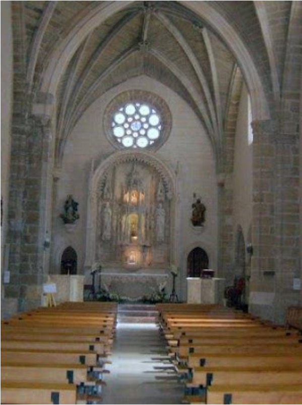
Iglesia de Santa Gadea

Según la tradición, el juramento que hubo de prestar Alfonso VI tuvo lugar en la iglesia de Santa Gadea, a finales del año 1072. Esto le costó al Cid su destierro de Castilla, a lo que se unió el hecho de que el conde de Nájera acusara al Cid de apropiarse de parte de las parias de Sevilla y de confabularse con García (hermano del rey) para derrocar a Alfonso VI. Éste haciendo caso de su amigo García-Ordoñez, desterró al Cid de Castilla en el año 1081.