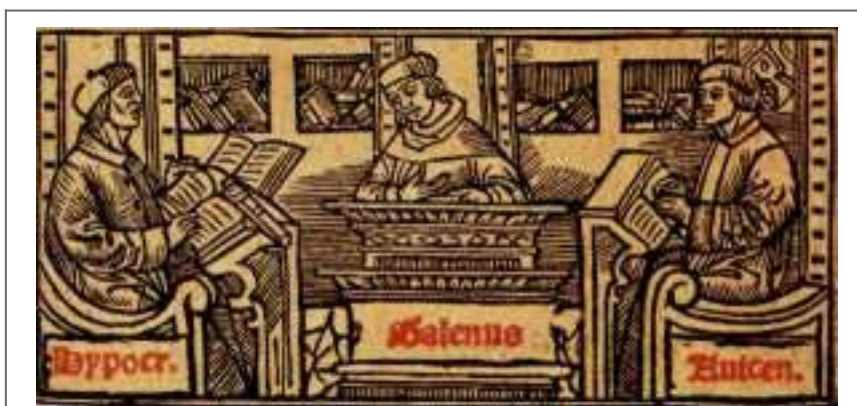
Padres de la Medicina hebrea

Sin embargo había diferencias notables, ya que los hebreos no creían con un mundo lleno de demonios y espíritus, sino que creían que había una causa sobrenatural para las enfermedades. Si bien en la Edad Media la superstición popular judía, acepta las ideas cabalísticas de la posesión por espíritus. En el periodo hebreo clásico, Jehová es el único poseedor y dador de la salud y la enfermedad sería un signo de impureza espiritual, por haber violado la prohibición referente al contacto con personas enfermas castigadas por Dios.