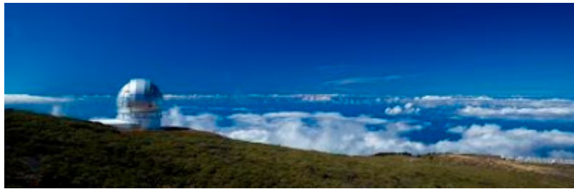
Roque de Los Muchachos

Hay un elemento natural que demuestra y deja claro que esta es una isla especialmente dotada por la madre naturaleza. Hablamos de su cielo. De ese cielo, especialmente de noche, limpio y claro que hace posible la observación astronómica hasta tal punto que cuenta con uno de los mejores observatorios del mundo, el Observatorio del Roque de los Muchachos a 2426 metros de altitud. Aquí se dan cita telescopios pertenecientes a varios países, tales como el TNG (Telescopio Nazionale Galileo ) o el ING (Isaac Newton group of Telescopes) y tiene el privilegio de contar con el telescopio más largo del mundo, el GRANTECAN (Gran Telescopio de Canarias) Toda una batería dedicada al estudio del cielo y a desvelar sus secretos, que cada noche abren sus cúpulas para acercarnos a las estrellas.