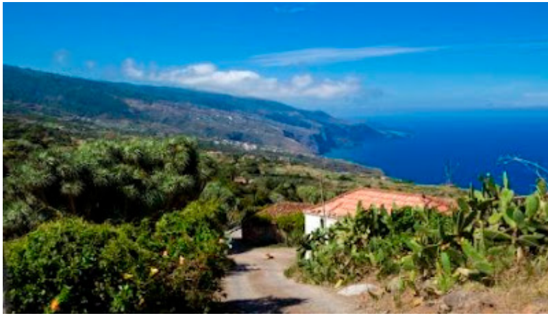
Barlovento, La Tosca

Destaca en la isla su orografía: escarpada, abrupta, con profundos barrancos y altas cimas. Una isla muy montañosa con una particularidad muy propia: su pequeño tamaño en relación con su considerable altura. No en vano, su pico más alto, el Roque de los Muchachos, alcanza los 2426 metros de altitud sobre el nivel del mar.