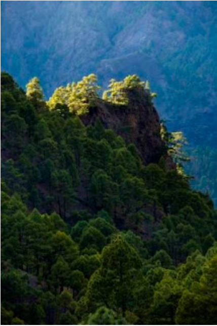
Caldera de Taburiente