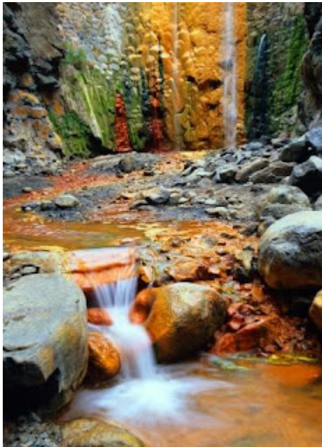
Cascada de colores-Taburiente

Como destaca también, y muy en sobremanera, por su vegetación y su naturaleza. Buena señal de ello son los espacios protegidos con lo que cuenta que ocupan un 35% del territorio de la isla. Se encuentran en sus límites un Parque Nacional (Parque Nacional de la Caldera de Taburiente), dos parques naturales y otros tantos monumentos naturales, paisajes protegidos, sitios de interés científico, reservas