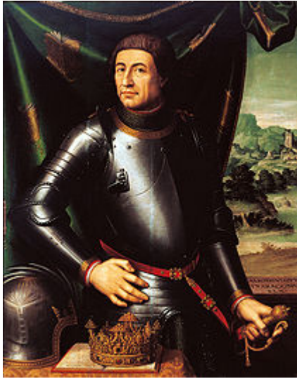
Alfonso V, el Magnanimo

Evidentemente, el Santo Cáliz de Valencia no deja de ser, precisamente, eso mismo: un cáliz ( una apreciadísima obra de orfebrería de influencia bizantina con un gran contenido legendario y religioso ). Pero lo que sí es, todavía más cierto, es que el gran contenido simbólico y espiritual de este relato legendario permanece auténticamente vivo y en plenitud de esencia en el ámbito geográfico de la comarca del campo de Jaca ( punto de entrada, en suelo hispánico, junto al Roncesvalles navarro de esta inmensa ruta iniciática, cristiana, celta e íbera que se llama Camino de Santiago ). En la religiosidad popular del campo de Jaca ( Ruta del Serrablo ), lo cristiano y lo pagano han estado siempre estrechamente ligados. Por tanto, la Iglesia ha sido consciente de la potencia del culto a la Naturaleza de forma que ha utilizado y canalizado estas creencias ancestrales a través de los santos locales. Sólo mencionaremos que los impresionantes y destacables accidentes orográficos, básicamente, el Viejo monasterio de San Juan de la Peña con su recogido enclave que se halla