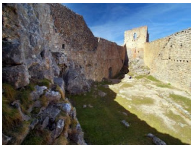
Castillo de Montsegur