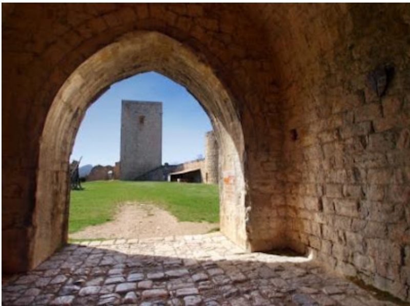
Castillo de Puivert

incrustado dentro de una gran mole conglomerada, el rígido e impávido macizo de Oroel, el enclave histórico de Jaca ( la vieja IACCA, puerta del Camino de SANT-IAGO: IACCO – HIACO – BACO, el dios-rey arquetipo de la inmortalidad a través de su propia pasión, muerte y resurrección, según relata el conocido historiador de religiones, J.G.Frazer, en su obra La Rama Dorada ), el Santuario del congosto de Santa Elena junto al río Gállego, el piedemonte del Puerto de Santa Orosia ( patrona de la ciudad de Jaca ) y el recóndito emplazamiento de San Urbez en el incomparable marco de la Sierra de Guara configuran el ámbito vivo de este excelso relato legendario.