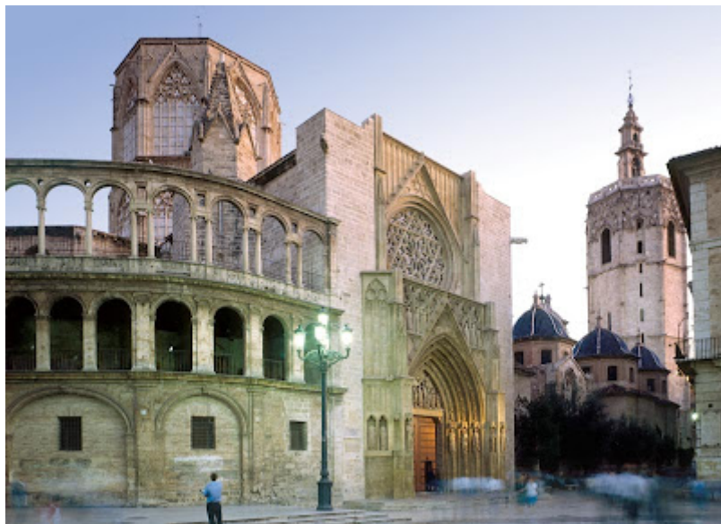
Catedral de Valencia

depositarla, después de un larguísimo viaje, en aquel místico emplazamiento de Occidente y que resulta ser, asimismo, la sede donde se halla enterrado el legendario Rey Arturo. Admirable es que en este enclave sagrado de Glastonbury se den cita la mitología celta de los ancestrales pueblos bretones, con la historia de las sucesivas protecciones de los antiguos reyes ingleses ( sajones y normandos ) y el fervor religioso de anglicanos, ortodoxos y católicos al aceptar que dicho sacro lugar representa ser el primer emplazamiento espiritual de sus respectivos cultos en las islas.