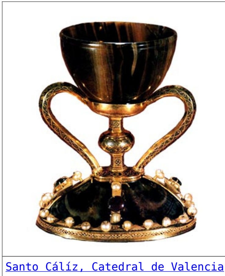
Santo Cáliz, Catedral de Valencia

La leyenda del grimal cátaro va íntimamente ligada al momento histórico de la rendición del castillo de Montsegur cuando cuatro fugitivos pudieron evadirse del cerco y asedio de las tropas del senescal francés llevándose consigo un precioso tesoro. Mucho se ha escrito respecto al tema del tesoro de Montsegur en cuanto si era un tesoro puramente material, o bien, si se trataba de otra clase de objeto, quizás, de gran significado espiritual. Verdaderamente ninguna evidencia objetiva ha podido aclarar dicho percance.