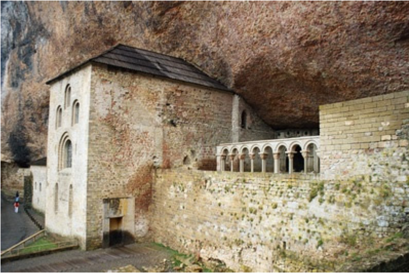
San Juan de la Peña (Huesca)