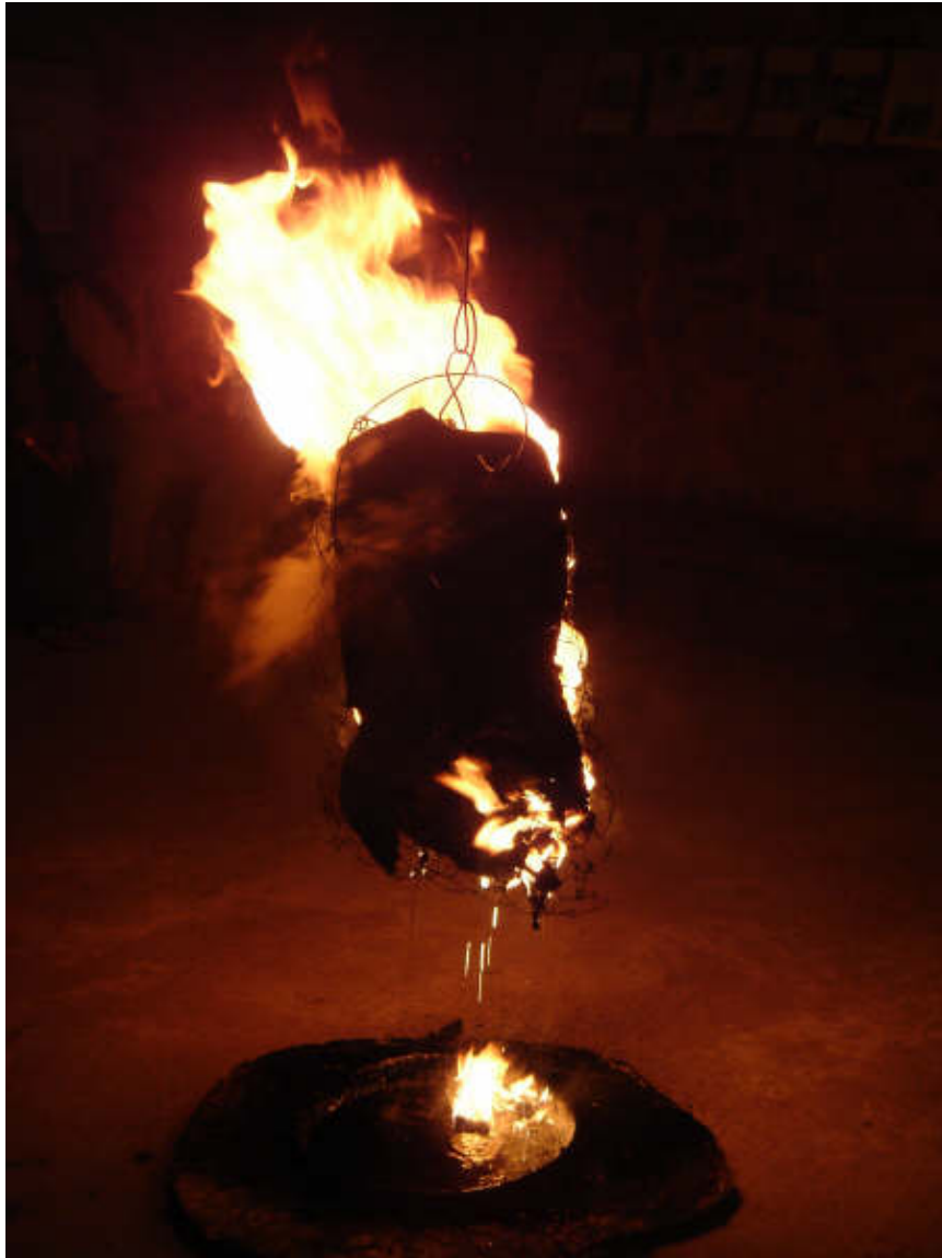
BOTO EN PLENA COMBUSTIÓN

En 1984, un reducido grupo de vecinos del barrio de la Puerta de la Villa, charlando sobre las fiestas y costumbres del pueblo, en las habituales “tomas de fresco” estivales, recordamos cómo la “Quema del Boto” en la Festividad de S. Roque, hacia años que no se realizaba. Sin dudarlo, ese mismo año se restauró la tradición. En años sucesivos, la asistencia al acto fue aumentando, hasta alcanzar una afluencia casi total de los habitantes, desde niños hasta los más ancianos de la localidad y cómo coincide con las vacaciones estivales, también todos aquellos que tienen su segunda residencia o familiares en Palazuelos.