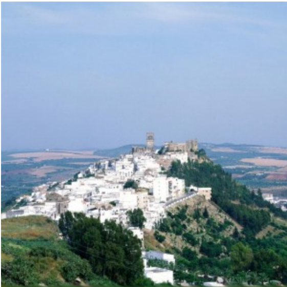
Arcos de la Frontera