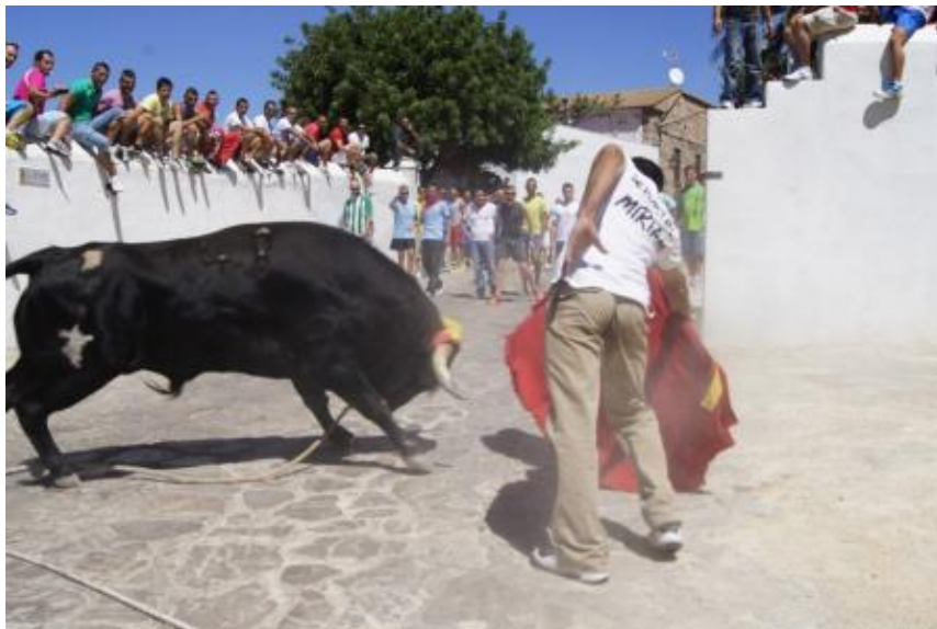
Toro de cuerda de Benaocaz

Relacionados con el toro están el toro de cuerda de Benaocaz, el toro del aguardiente de Puerto Serrano o el de cuerda de Benamahoma. Única es también en esta villa la fiesta de moros y cristianos.