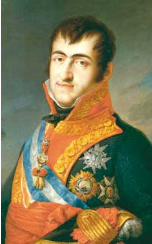
Fernando VII, Oleo de Vicente López, 1814 Museo del Prado (Madrid)

La Revolución Francesa significó el triunfo del liberalismo y de los derechos naturales del hombre, entre los cuales se hallaban la libertad de cultos y la ruptura con el tradicionalismo político y religioso.