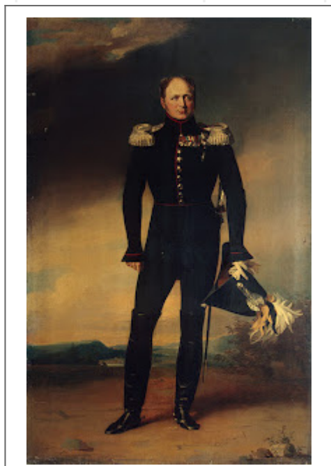
Zar Alejandro I

Derrotado Napoleón, el triunfo de las monarquías los colocó en una posición políticamente fuerte, y decididos a recuperar el poder político y territorial perdido. Así cuatro potencias (Gran Bretaña, Austria, Prusia y Rusia) se reunieron en el congreso de Viena en 1815, para volver la situación al estado anterior a la Revolución Francesa, como si ésta no hubiese sucedido, estableciendo el principio de la intervención por el cual, las monarquías se defenderían entre sí enviando sus fuerzas, para colaborar en la restauración de aquellos reyes, que fueran depuestos por las fuerzas liberales.