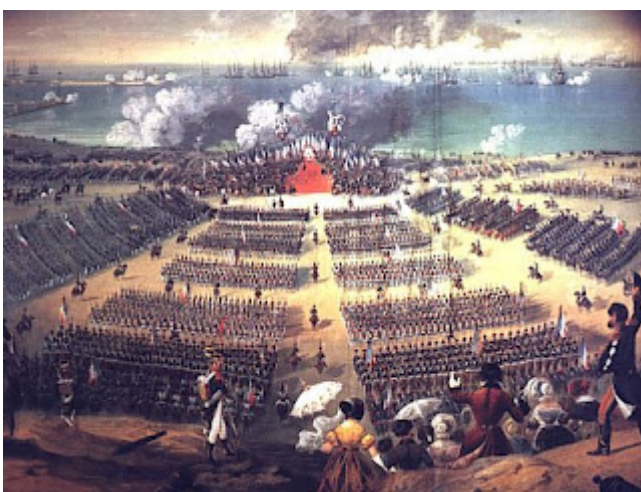
Los Cien Mil Hijos de San Luis

Este acuerdo defensor de los principios absolutista intervino militarmente en el Reino de la Dos Sicilias (Sicilia y Nápoles) y España (1823) con el objetivo de sofocar las experiencias liberales que estaban teniendo lugar en dichos países y restaurar el absolutismo En España los llamados Cien Mil Hijos de San Luis terminaron con la experiencia constitucional del denominado Trienio Liberal (1820-1823) y restauraron al rey Fernando VII como rey absoluto