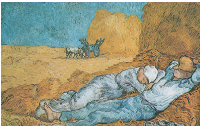
La siesta de Vicent Van Gogh

Esta sana y clásica costumbre española, ha llamado mucho la atención en otros países y en particular en los nórdicos, por lo que se nos ha criticado como si fuera un vicio, una muestra de vagancia y una pérdida de tiempo. Pero nosotros consideramos que no hay tal pérdida puesto que esa media o una hora que estamos en los brazos de Morfeo, se recupera por la noche al poder acostarse más tarde y con mejores facultades cerebrales y anímicas; por otra parte si no se duerme está comprobado que se trabaja menos y se rinde peor, porque el estómago, en esa hora crucial de la digestión, utiliza más sangre de la circulación general, en detrimento de la que debería llegar al cerebro y a otros órganos del cuerpo.