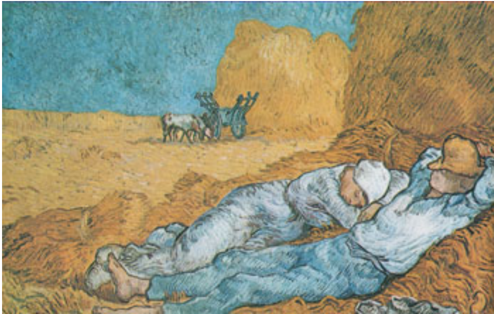
La siesta-VICENT VAN GOGH-Saint-Rémy1890

Podemos asegurar que no hay ni hubo en la historia tal invento, pues esa costumbre o mejor necesidad, de descansar y dormir después de una buena comida cuando el estómago está digiriendo -y que como consecuencia se produce esa modorra o ese sopor, por falta de riego sanguíneo en el cerebro-, induce cuanto menos a la somnolencia, a la inmovilidad, a no hacer nada. Y esto ha sucedido así desde siempre e, incluso, podemos asegurar que también se ha dado y se da en numerosos animales.