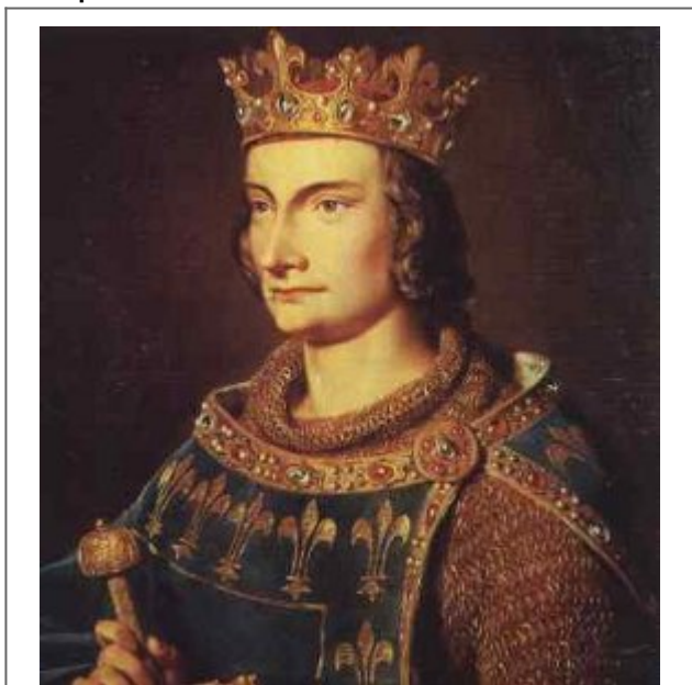
El Rey de Francia Felipe IV

los templarios lograron refugiar en la casa del temple, sede de la Banca y del Maestre. Calculamos que en los tres o cuatro días que duro la revuelta, tanto el rey francés como su ministro Nogaret, tuvieron tiempo de darse cuenta que allí, estaba la solución de todos sus problemas económicos y más después de haberse negado el Maestre a fusionarse con los hospitalarios.