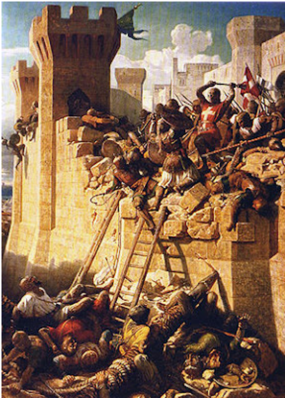
Toma de San Juan

La supresión de la Orden del Temple, fue un cúmulo de circunstancias, en la que los templarios, no fueron totalmente ajenos, más bien diría que la culpa principal fue de ellos.