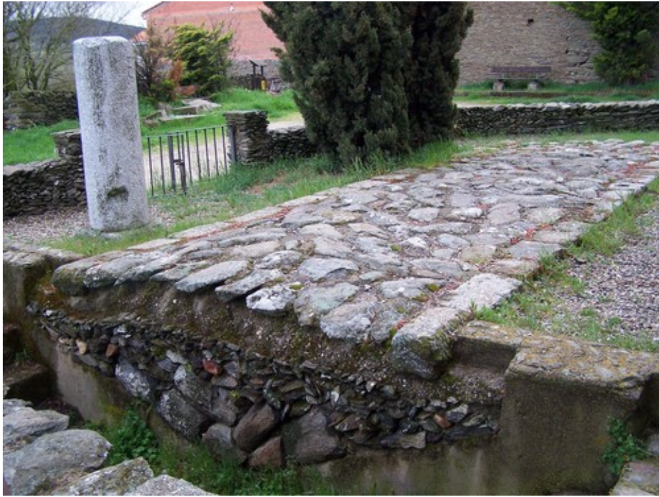
Corte de una calzada romana y Millare

Utilizaban ángulos rectos y el nivel para determinar la elevación. Primero tomaban una referencia visual desde uno de los ejes de la groma, para después moverse alrededor y colocar las líneas en ángulos rectos, esta era la técnica para las distancias más cortas, para las más largas, los romanos, se fijaban en las colinas y el horizonte para clavar palos a unas distancias determinadas por los lugares donde querían ir. Los postes los unían con unas cuerdas en línea recta, como no podían prospectar alrededor de las esquinas, todas las calzadas se hacía