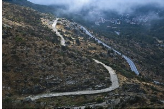
Calzada por la sierra de Gredos

200 años se construyó un sistema de carreteras de más de 100.000 km. Capaz de llegar hasta las fronteras más lejanas del imperio romano.