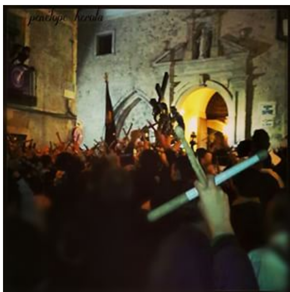
Madrugada, a la salida del Santísimo