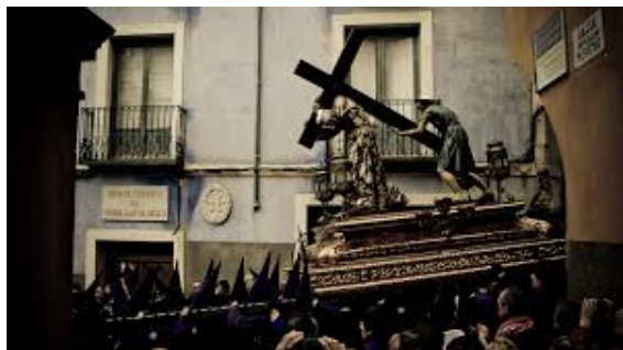
El Santísimo de las seis