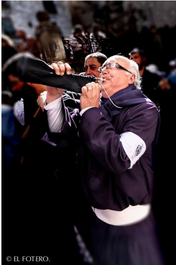
«La Trompeta».

Mística y Música, Pasión y Canto, Dolor y Alegría, Sentimiento y Gozo. Todo en un todo, nuestra Semana Santa es especial en su contenido.