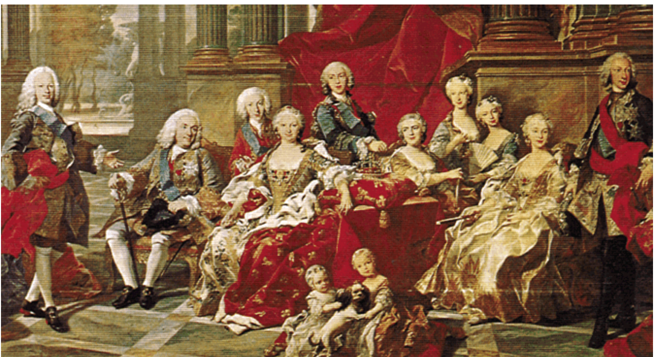
La ilustración con Felipe V