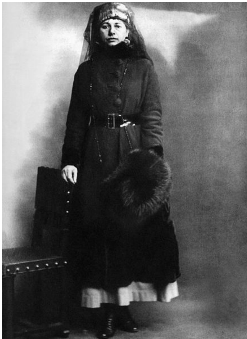
Mata Hari en el día que la arrestaron el 13 de febrero de 1917

enamoró de él y que le ofreció una buena suma de dinero para que le suministrara información castrense, dada su relación con los militares galos.