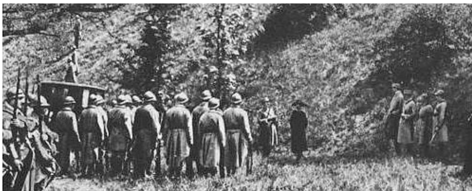
El pelotón de fusilamiento. De las 12 balas,

Pudo ser la psicosis de la guerra que padecía Francia y no la verdadera culpabilidad del espionaje.