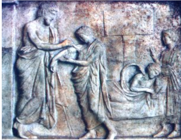
Relieve de la escuela de medicina de la isla de Cos

Al visitar una casa, entrar en ella para bien de los enfermos, manteniéndome al margen de daños voluntarios y de actos perversos, en especial de todo intento de seducir a mujeres o muchachos, ya sean libres o esclavos.