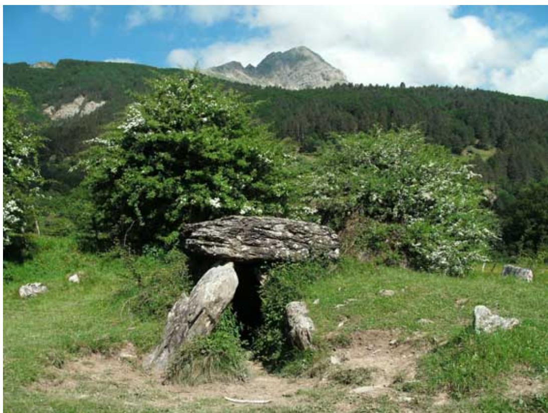
Dolmen de Arrako. Se puede apreciar parte del cromlech que lo rodea.

muertos. Alrededor del monumento prehistórico se conserva el cromlech que lo rodea. Cerca del dolmen se eleva una ermita. Ermita y dolmen hacen pensar que este lugar siempre ha sido especial para los pobladores del valle desde la prehistoria hasta el presente. Hay postes señalizadores desde la carretera que comunica el pueblo de Isaba con Belagua que llevan sin pérdida al monumento prehistórico.