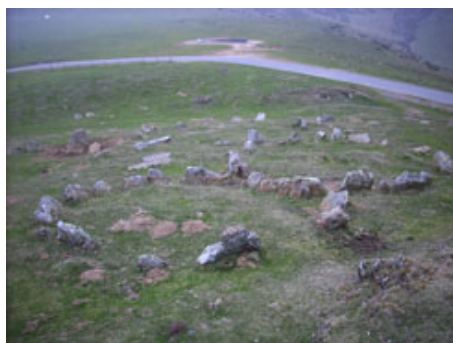
Grupo de cromlechs en Azpegi

Se encuentra cerca de la Fábrica de Armas de Orbaizeta, en el Valle de Aezkoa. Junto a la Iglesia sale la pista asfaltada