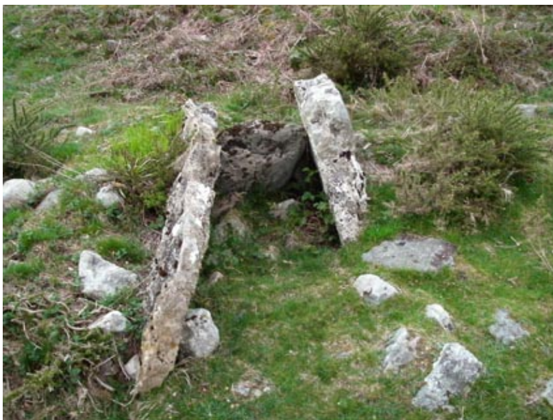
Uno de los dólmenes cercanos al albergue de Sorogain

En el valle de Erro, entre Biskarret y Mezkiritz, una estrecha pista asfaltada lleva al valle de Sorogain. En el hay un albergue que es el punto de partida de una ruta arqueológica señalizada con paneles informativos que va a llevarnos a conocer varios dólmenes y un magnífico cromlech.