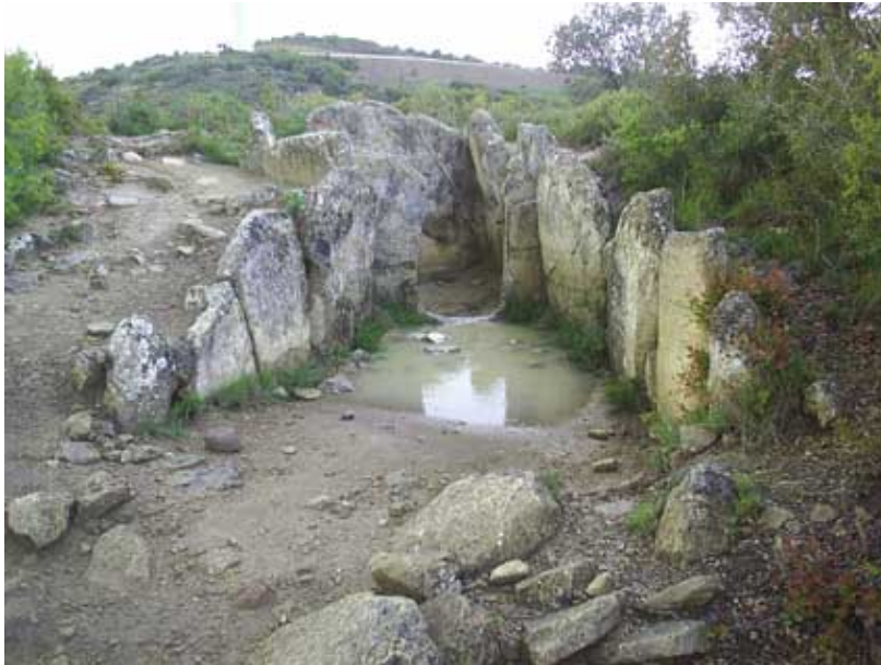
Dolmen de la Mina.

Esta seis estaciones arqueológicas no agotan ni mucho menos la riqueza megalítica de Navarra, pero si que permiten conocer los diferentes tipos de monumentos prehistóricos y los paisajes que poblaron los antiguos habitantes de estas tierras.