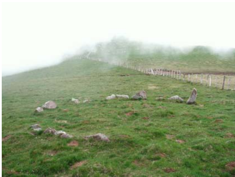
Cromlech de Okabe.

de longitud. Hay que imaginarse la poderosa estampa que crearía en el collado esta enorme piedra de varias toneladas de peso que ahora se encuentra caída. Los dólmenes, menhires y cromlechs que ellos levantaron, tenían su réplica natural en esta montaña de piedras que es el Argintzo. También en la vertiente Este de este monte encontramos megalitos. Otro menhir tumbado y varios cromlechs completan la colección de monumentos que adornan este hermoso y mágico lugar en la prehistoria.