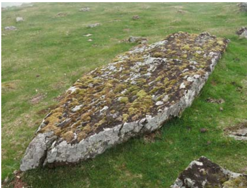
El menhir del Adi.

estación de Sorogain. Para llegar a los monumentos megalíticos hay que seguir el sendero de gran recorrido GR-11 desde Sorogain en dirección al puerto de Urkiaga. En los prados de la parte mas alta de este tramo del sendero transpirenaico se encuentra la estación megalítica.