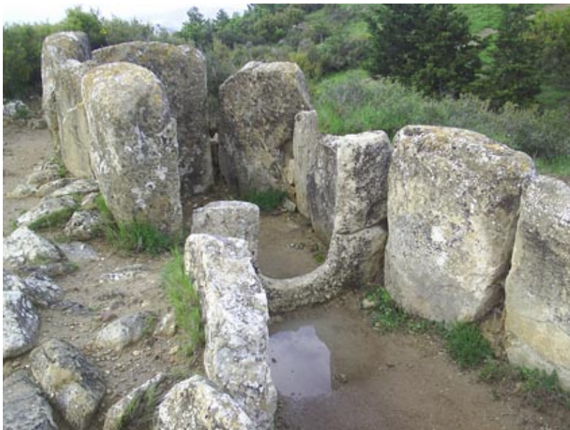
El dolmen de Portillo de Eneriz en Artajona.

El hombre prehistórico vivía integrado en la naturaleza. Su vida, su subsistencia, dependía de la lectura que hiciera de lo que le rodeaba. Árboles, ríos, montañas y peñas eran vistos de forma diferente a como ahora los ve el hombre contemporáneo.