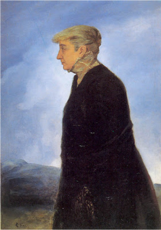
La madre del pintor (1909)

Este museo, ubicado en lo que se conoce como Finca de La Redonda, antigua casa rural, hoy 16.000 metros cuadrados de espléndido jardín y con una variedad que supera el centenar de árboles y arbustos, buena parte de ellos tropicales, ejemplares únicos o muy escasos en la jardinería y botánica española. Lo integran dos edificios, uno de construcción más reciente, y el otro, reformado, que viene a través del tiempo.