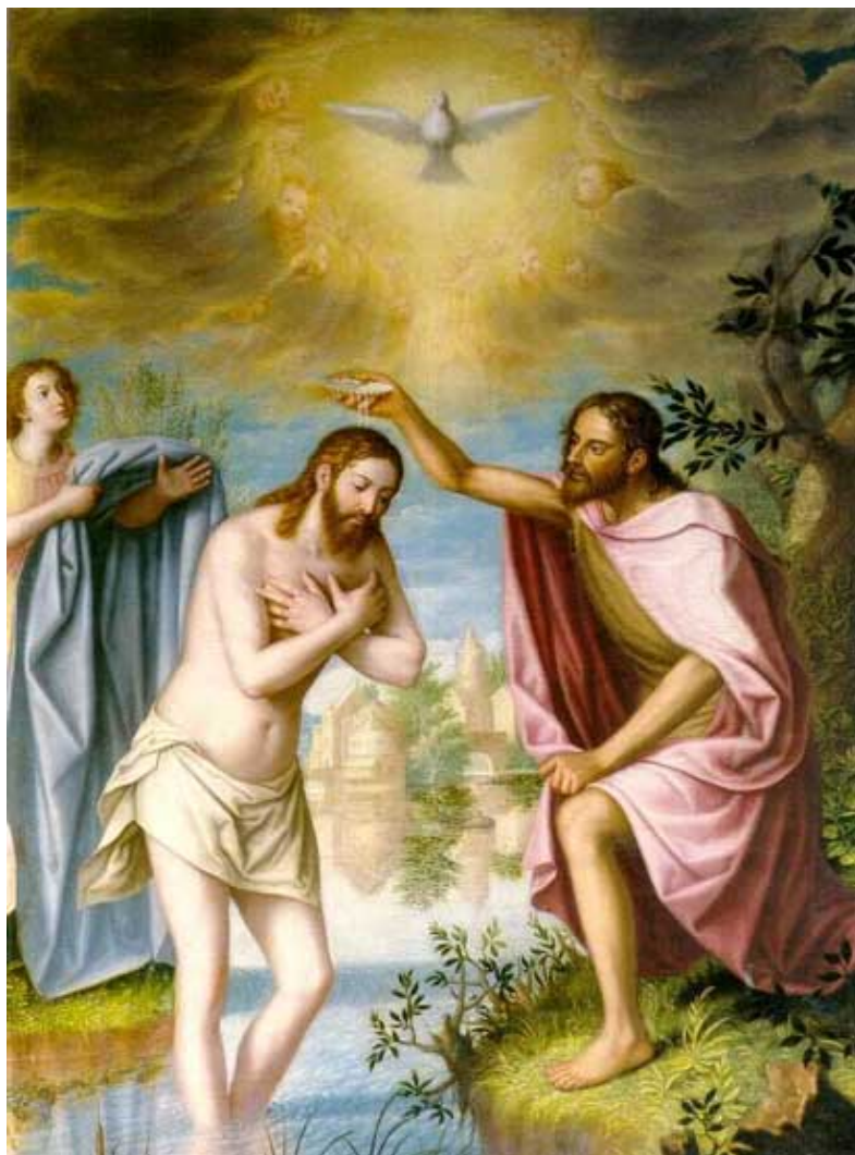
Bautismo de Cristo

que fueron realizadas, mientras que el resto se encuentran en el museo de Granada. De ellas destacan las dos series narrativas de la historia de la Orden, la de sus orígenes según la leyenda, y la crónica de los primeros mártires de Inglaterra.