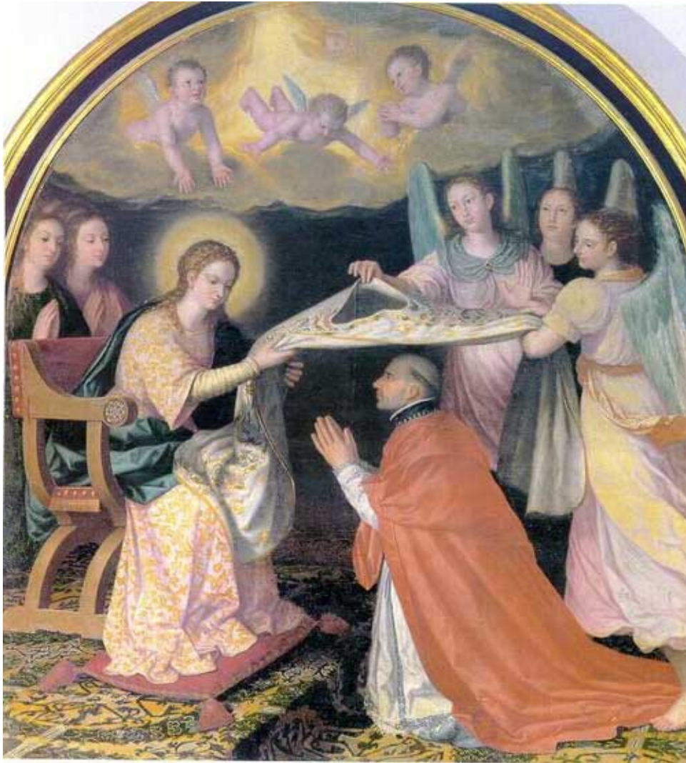
Imposición de la Casulla a San Idelfonso

Establecido en Toledo, contaba con una importante clientela como pintor religioso y retratista; en esta ciudad permaneció activo hasta 1603, año en que se trasladó a Granada, donde profesó como monje en la Cartuja el 8 de septiembre de 1604, deseoso de vivir en el retiro para entregarse completamente al arte. De sus obras toledanas la más temprana es el