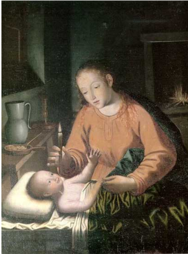
Virgen despertando al niño

A partir de este momento su actividad se va a repartir entre las cartujas del Paular, donde se encontraba desde 1610 a 1612, y de Granada, en la que permaneció hasta su muerte; siempre se distinguió, tanto por su escrupulosidad en la observancia de su regla, como por la amabilidad y sencillez con que se esforzaba en complacer y ser útil a