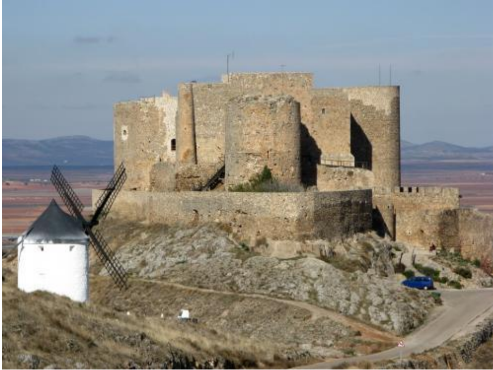
CASTILLO DE CONSUEGRA Y UNO DE LOS MOLINOS DEL CERRO CALDERICO

Los romanos ya descubrieron la situación estratégica de este cerro y la ciudad a sus pies a como así lo muestran los hallazgos encontrados en Consuegra, el acueducto, las termas, murallas y el circo.