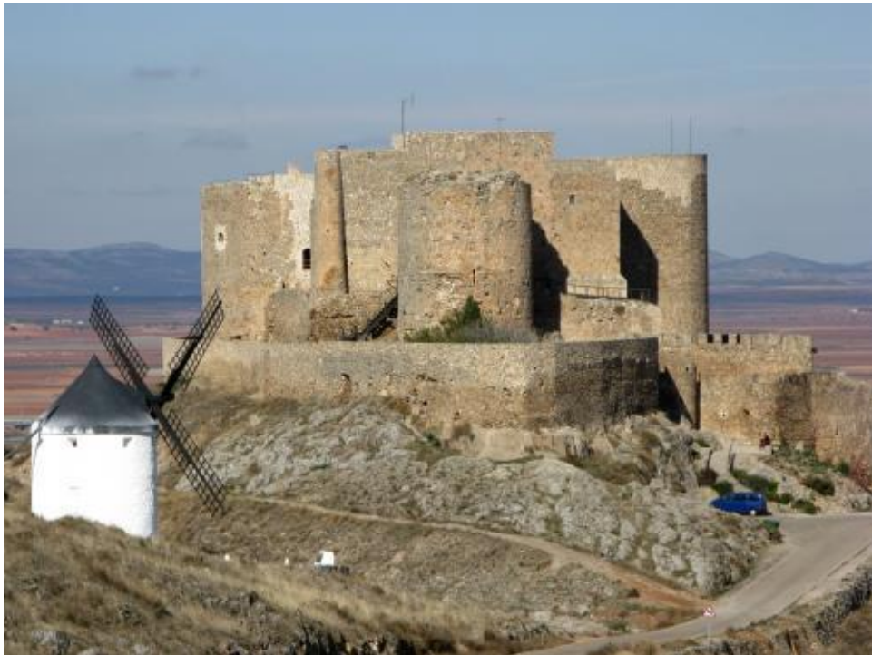
CASTILLO DE CONSUEGRA Y UNO DE LOS MOLINOS DEL CERRO CALDERICO

Los romanos ya descubrieron la situación estratégica de este cerro y la ciudad a sus pies a como así lo muestran los hallazgos encontrados en Consuegra, el acueducto, las termas, murallas y el circo.