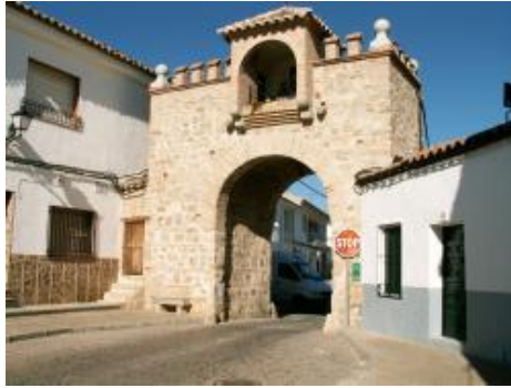
PUERTA DE BELEN- RESTOS DE LA ANTIGUA MURALLA

cada casa, cada patio, es monumento en la mente, es monumento en el tiempo, con la historia que desprende sin querer le vas queriendo.../