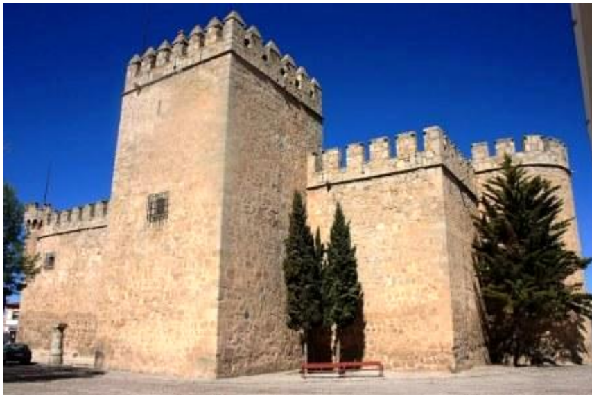
CASTILLO DE ORGAZ

Entramos en la Villa de Orgaz, sus calles están llenas de rincones y arcos de puertas de lo que fue la muralla que rodeaba a la ciudad, hay que mencionar especialmente su iglesia que es una de la de estilo barroco más bellas e importante de la provincia de Toledo. La obra fue proyectada por Alberto Churriguera.