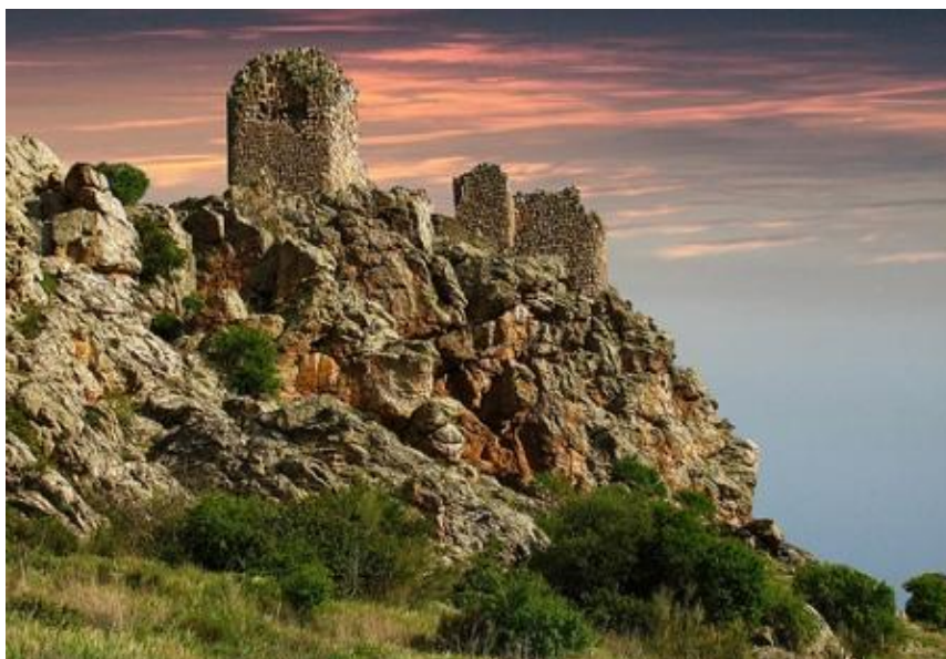
CASTILLO DE PIEDRA NEGRA

En las tierras toledanas ocupadas por los campos de azafrán, nos encontramos sobre una de las colinas de la sierra de Mora el primer castillo de esta ruta.