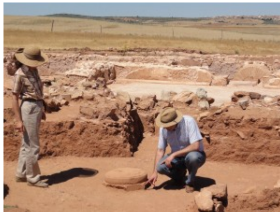
ARQUEÓLOGOS CANADIENSES, TRABAJANDO EN LA VILLA Y TERMAS ROMANAS DE OCTAVIA

altura a la fortaleza, que se haría mediante un puente levadizo. Por las afueras del pueblo podemos ver las excavaciones arqueológicas de las termas romanas de Ontavia donde se han encontrado amplias dependencias y piscinas que sirvieron hace 1.700 años para tomar plácidos baños calientes, templados y fríos. Estas instalaciones son el mayor complejo termal antiguo conocido en la provincia de Ciudad Real y se encuentran estratégicamente emplazadas junto a la Vía que unía Cádiz con Roma; una verdadera autovía de la Época Antigua, por la cual llegó a pasar Julio César al mando de sus legiones.