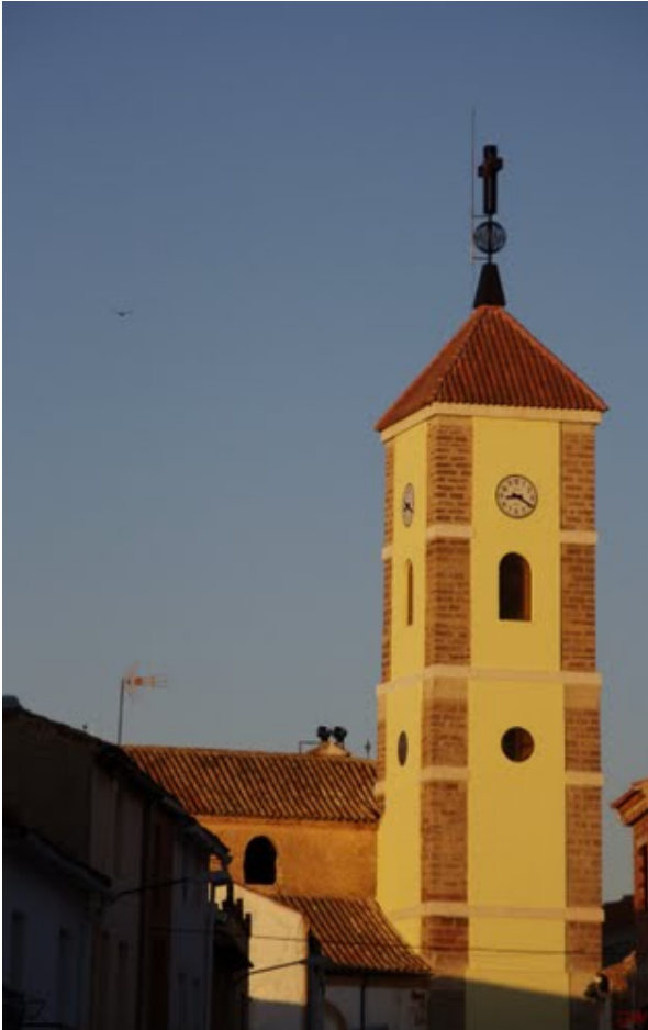
TORRE DE LA IGLESIA PARROQUIAL DE VILLANUEVA DE LA FUENTE.

Cerca de Villahermosa y a tan sólo 16 km se encuentra la Laguna Blanca, perteneciente al Parque Natural de las Lagunas de Ruidera, se trata de uno de los espacios más bellos de la región, un hermoso enclave paisajístico y un lugar privilegiado. Un rosario de 15 lagunas a lo largo de 25 km enlazadas unas con otra.