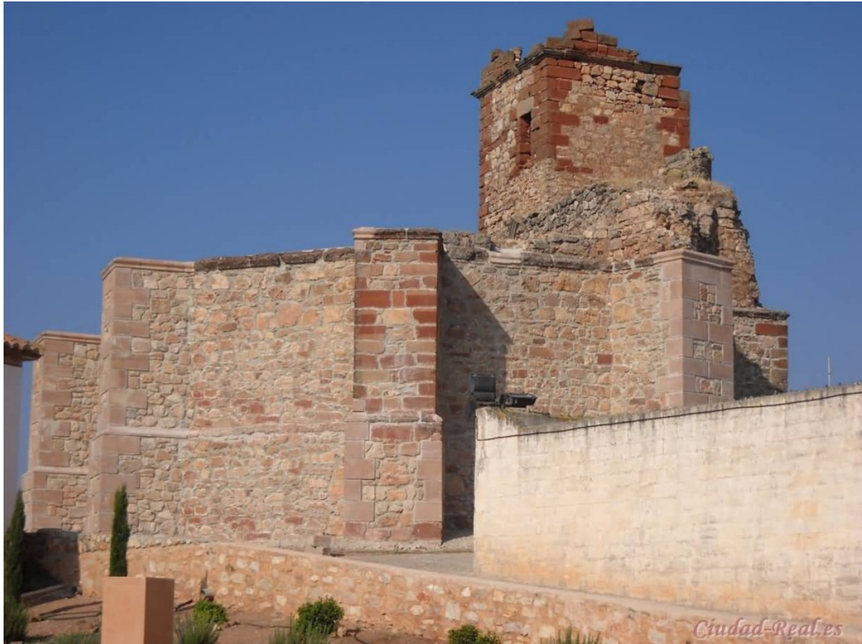
CASTILLO-IGLESIA DE SANTA CATALINA

Desde Villanueva y estando caliente uno de tanta cultura, nos vamos hacia Fuenllana , tierra del Santo Tomás de Villanueva. Un pueblo manchego, pequeño, lleno de viejas costumbres, nos espera con sus calles estrechas y protegido por las colinas de su entorno. Su historia, aunque lejana en los tiempos aparentemente no ha influenciado en la zona. Sus monumentos son varios, los fuenllaneros, están orgullosos de poder tener mezcladas entre sus calles la iglesia-fortaleza de Santa Catalina (siglo XIII-XV).