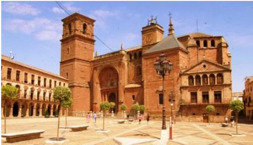
PLAZA MAYOR DE VILLANUEVA DE LOS INFANTE, CON LA IGLESIA DE SAN ANDRÉS APOSTOL

Los infanteños e infanteñas, están orgullosos de tener los restos de Don Francisco de Quevedo y Villegas, . También se puede encontrar paseando por sus medievales calles con la Casa del Caballero del Verde Gabán, citada en el capítulo XVIII de la 2ª parte de nuestro Quijote de Cervantes, y con la Casa del Marqués de Camacho, El Palacio de Melgarejo, o la casa cuartel de los Caballeros de la Orden de Santiago, sin olvidarnos del Palacio de Revuelta y el Covento de la Encarnación, o la casa de la Inquisición, el convento de Trinitarios y la Casa de Arcos que perteneció a JuanOrtega Montáñez, Arzobispo y Virrey de México y pariente del santo, Santo Tomás de Villanueva. Si salimos un poco por sus campo, nos tropezaremos con la cultura romana, representada en estas tierras por yacimiento arqueológico de Jamilla