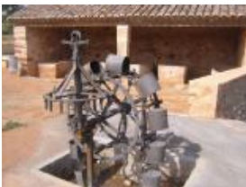
LAVADEROS DE LAS MONJAS

Desde Villanueva y estando caliente uno de tanta cultura, nos vamos hacia Fuenllana , tierra del Santo Tomás de Villanueva. Un pueblo manchego, pequeño, lleno de viejas costumbres, nos espera con sus calles estrechas y protegido por las colinas de su entorno. Su historia, aunque lejana en los tiempos aparentemente no ha influenciado en la zona. Sus monumentos son varios, los fuenllaneros, están orgullosos de poder tener mezcladas entre sus calles la iglesia-fortaleza de Santa Catalina (siglo XIII-XV).