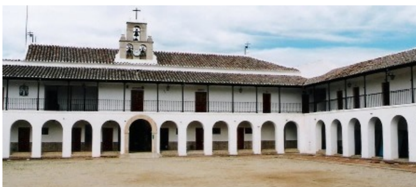
El Santuario de Nuestra Señora de la Carrasca y plaza de toros.

Cuando salgamos de esta Villa veremos que las perdices, codornices o conejos, se nos cruzan por nuestro entorno hasta llegar a la antigua aldea de Pozuelo y hoy la Villa de Villahermosa .