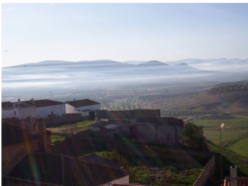
VISTAS DESDE EL CERRO DEL CASTILLO

la reconquista castellana -hacia el 1214-, la villa pasa a poder de la Orden Militar de Santiago, integrada en la encomienda de Segura de la Sierra, hasta que en 1566 logra su independencia de esta última y el villazgo, al tiempo que el vetusto castillo pierde su interés militar. Situación jurisdiccional que se mantendrá sin cambios hasta los primeros años del siglo XIX, en que las Cortes de Cádiz declaran la abolición del régimen señorial. Luego de 1833, Albaladejo es uno más de los municipios que forman la provincia de Ciudad Real