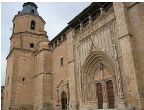
IGLESIA PARROQUIAL NUESTRA SEÑORA DE LA ASUNCIÓN. EN SU INTERIOR ALBERGA UN ÓRGANO DEL SIGLO XVIII

uno de los tesoros de la Villa, su iglesia, dedicada a Nuestra Señora de la Asunción, es de estilo gótico florido (siglo XV-XVI) con elementos barrocos y renacentistas