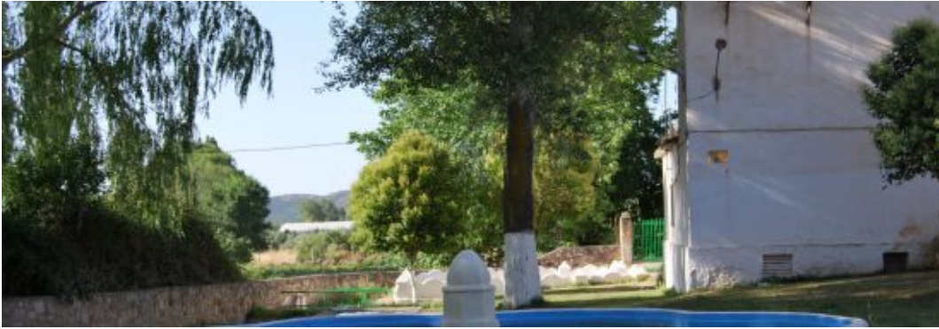
PARQUE NATURAL DEL NACIMIENTO DEL RÍO VILLANUEVA, AFLUENTE DEL GUDALQUIVIR

trayecto de la Vía Hercúlea, que desde Cádiz hasta Roma pasaba por Mentesa Oretana.