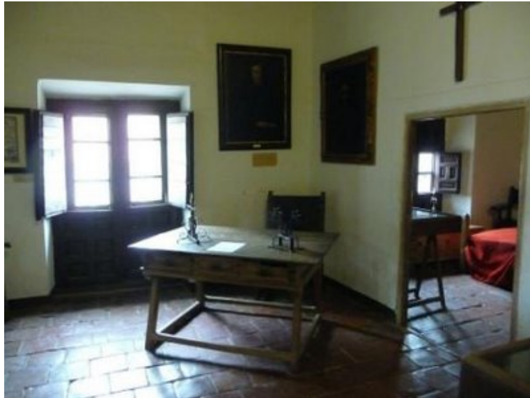
CELDA DE QUEVEDO, DONDE ESCRIBIÓ SUS ÚLTIMOS VERSOS