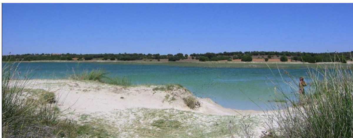
LAGUNA BLANCA, PERTENECIENTE AL ENTRAMADO LAGUNERO DE LAS LAGUNAS DE RUIDERA

En el caminar por sus blancas calles podremos contemplar una gran cantidad de casas solariegas desde los siglos XV al XVII, en las que cabe destacar a las del Marquesado de Villahermosa, Casa del Ayuntamiento, Casa del Arco, Casa del Comendador, Casa de Márquez y Casa de los Poblador, así como sus ermitas destacando entre ellas la de San Agustín, patrono de la Villa del siglo XVII.