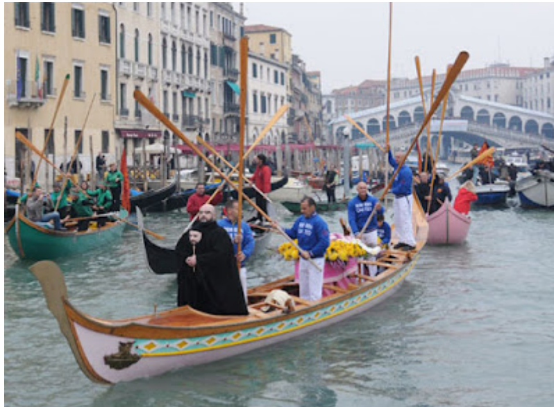
FUNERAL POR VENEZIA

generalmente con el tejado de tejas en el que se levantan las altas y típicas chimeneas invertidas " fumaioli ", adornando sus fachadas con balcones floridos, molduras y puertas monumentales.