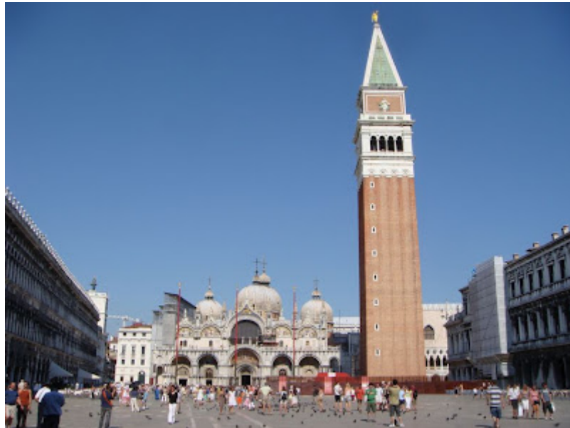
PLAZA DE SAN MARCOS

Diversos colectivos venecianos desde hace varios años ponen todos sus esfuerzos para alertar sobre el grave problema de despoblación que sufre, sirviendo como ejemplo recordar la sorpresa vivida por nuestro grupo de turistas españoles en Venecia, a mediados de Noviembre del 2009, viendo pasar por el Puente de Rialto, en original protesta, un verdadero cortejo fúnebre formado por unas 300 personas en toda clase de embarcaciones presididas por una góndola portando un ataúd rosa que representaba la muerte de la ciudad, y que según reflejaron los medios de comunicación, terminaría ante la sede del Ayuntamiento, donde se pronunció una oración fúnebre en dialecto veneciano, abriendo el féretro del que extrajeron la bandera de la Fenice (Ave Fénix), uno de los símbolos de Venecia y de su renacer. Lo que deseamos de todo corazón