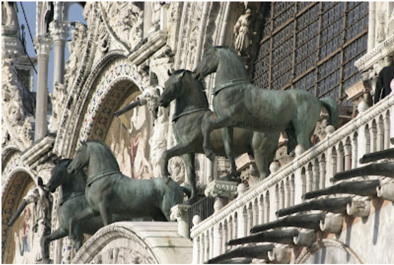
CABALLOS DE SAN MARCOS

Y es que Venecia está construida en el agua, pues aunque existen bancos de arena emergentes que forman islas, otros muchos quedan a la altura de la superficie del agua y, sobre ambas bases se ha construido, siendo sus cimientos tributarios de esos terrenos arenosos, más o menos fangosos e inestables del fondo de la laguna. Volvemos a la técnica de los palafitos clavando “estacas” de alerce o de roble de 2 a 4 metros de longitud hasta alcanzar la capa de arcilla sólida más profunda, separándolas unos 80 cm. entre sí y formando círculos concéntricos o en espiral de acuerdo al contorno del edificio; sobre esta base se colocan las vigas reticulares y por encima: bloques de piedra de Istria que sirven de asiento a un basamento de ladrillo y argamasa, sobre el que se construye el edificio (el número de estacas o pilotes necesarios es impresionante: 1.106.657 en la Basílica de Santa María de la Salud y 10.000 en el Puente de Rialto).